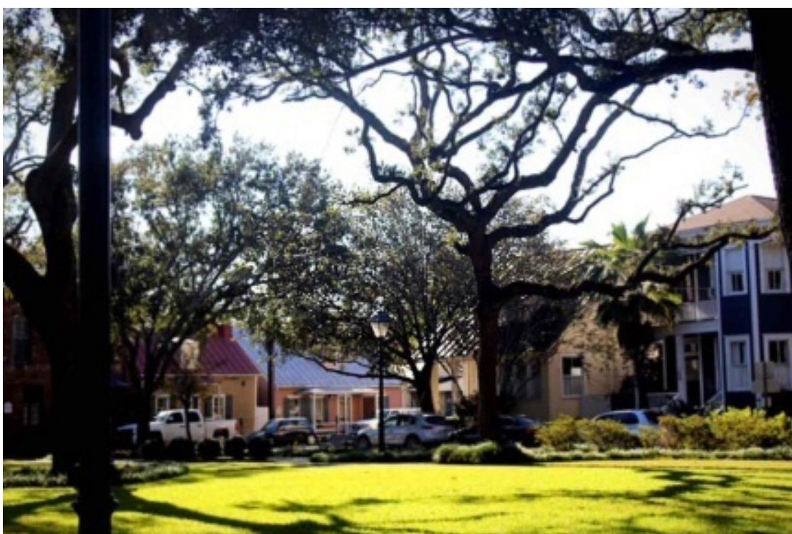
Типичный сквер в Саванне.