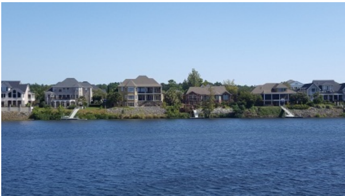
Вид с набережной Огасти