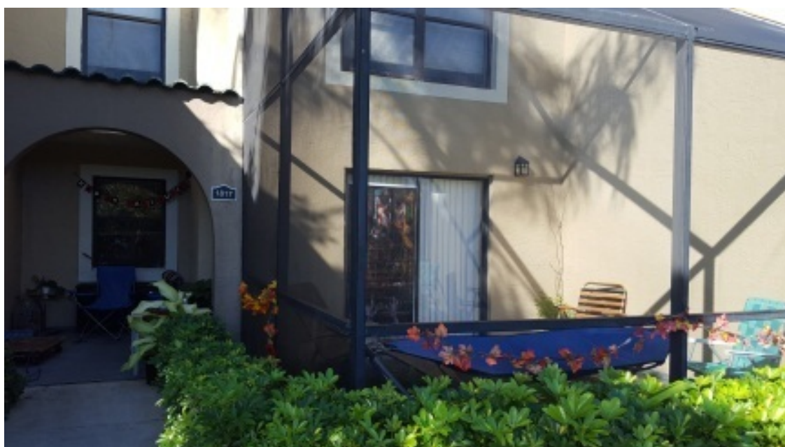
Типичный балкон в нашем посёлке