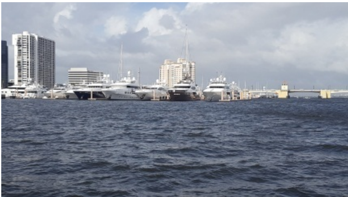
Вид с набережной