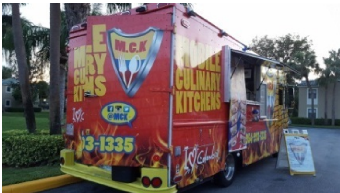
Фургончик с фаст-фудом в посёлке

Оказывается, мы не единственные, кто придумал издеваться над благородным продуктом. Американцы тоже категорически не умеют делать сыр. У них он получается весь на один вкус, и по консистенции – что-то среднее между традиционным советским полутвёрдым сыром и плавленым. Как поясняют сами американцы, причина этого – «время-деньги». Не в их традициях сделать продукт и ждать результата год, а то 5. Такой размеренный темп могут позволить себе только европейцы. В результате американский сыр годится разве что для горячих бутербродов или непритязательных «макарон с сыром». А за «праздником вкуса» нужно идти к прилавку с европейским сыром. Который стоит намного дороже американского, но прилично дешевле, чем он стоит в России.