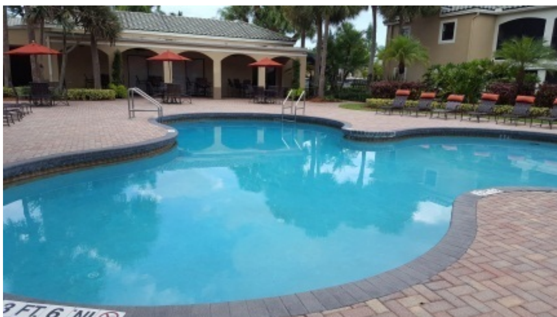
Бассейн нашего посёлка