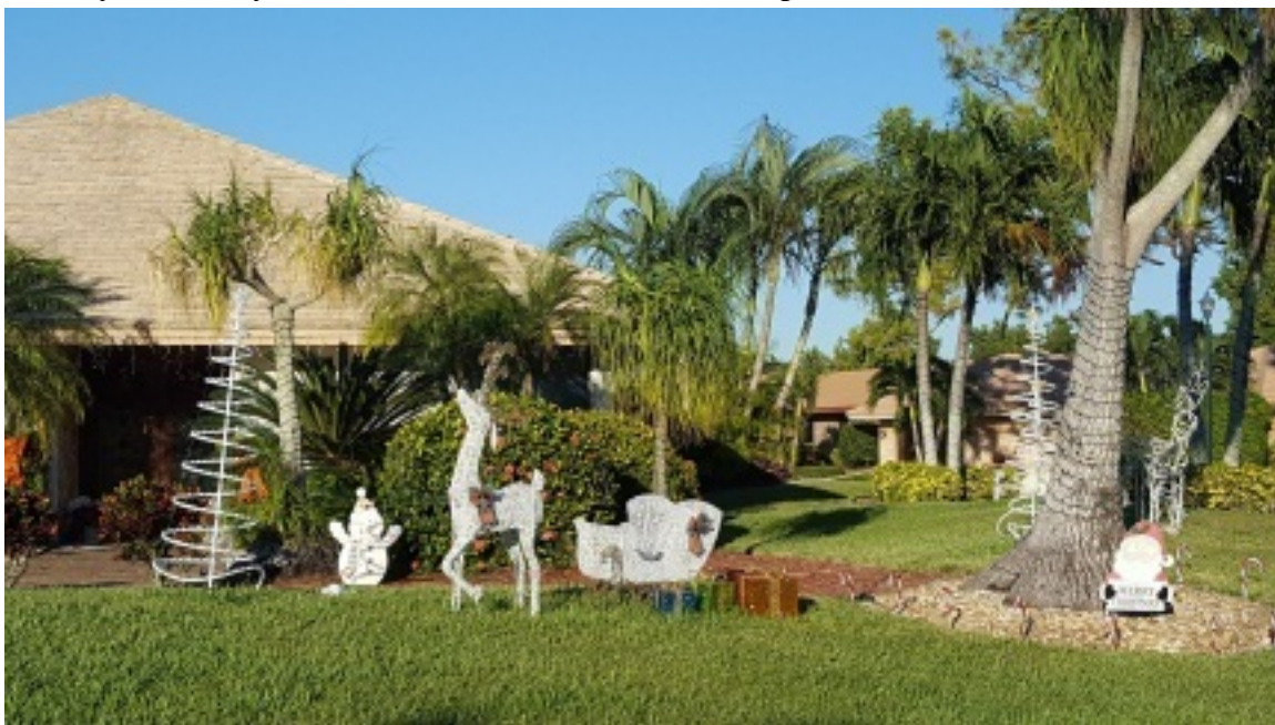
Украшение жителями своих лужаек перед домом.

– вторые отмечали на улице – на площадях и пляжах. Мы встретили Новый 2018 год на пляже в West Palm Beach. В полночь там был большой салют над акваторией бухты. Салюты устраивались почти во всех местных городах. Людей было очень много, многие пришли со своими раскладными пляжными креслами и пледами, кто-то расстилал одеяла на газонах, кто-то сидел на лавочках или просто гулял. Многие выпивали – видимо в честь праздника, полиция смотрела на это сквозь пальцы. Правда, пьяных не было совсем. Первый раз мы наконец-то увидели в Америке «разносную» торговлю: несколько человек с тележками продавали светящиеся украшения и детские игрушки. От покупателей у них не было отбоя – практически все были украшены чем-то мигающим, светящимся. Сам праздник прошёл очень мирно – все посмотрели салют и разошлись. Не было ни агрессивных людей, ни даже просто очень веселящихся, танцующих на улице – как это обычно бывает в Европе.