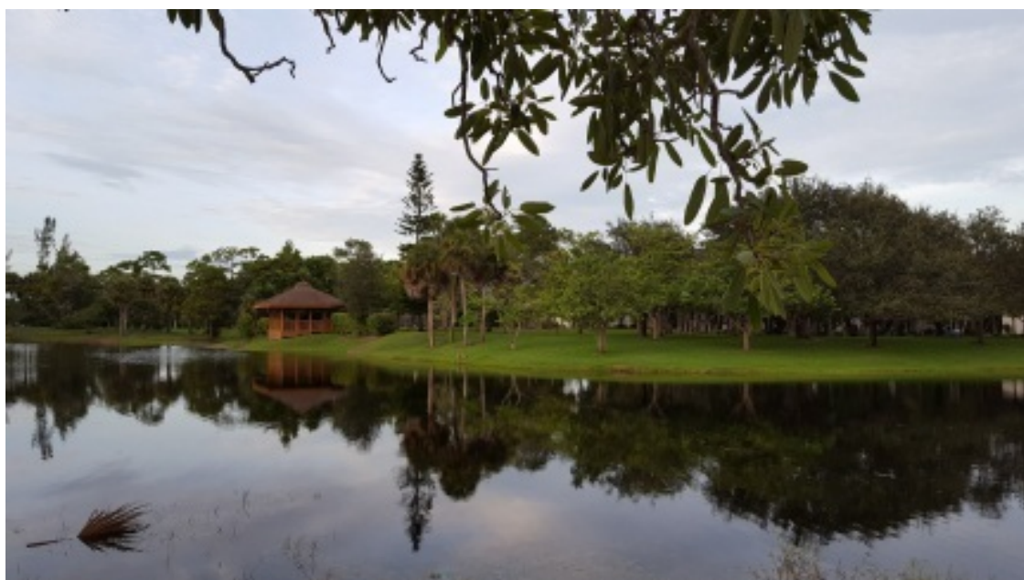
Частный парк нашего посёлка.