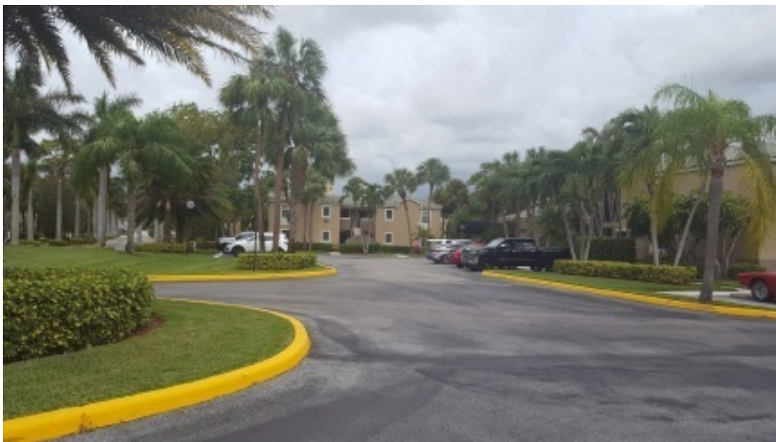
Наш посёлок в городе Бока Ратон.