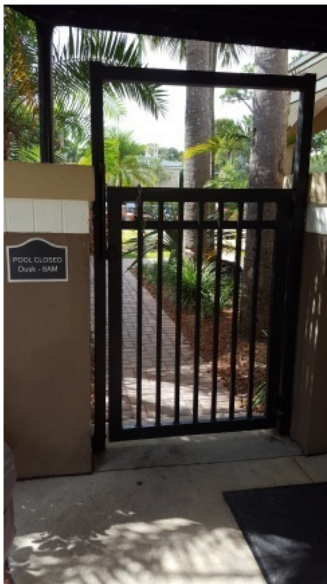
Калитка в бассейн