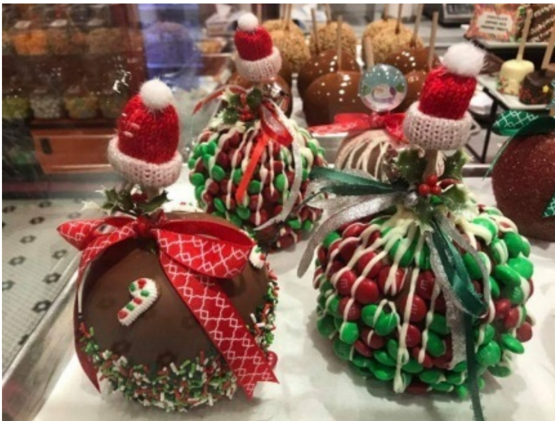
Рождественские сладости на ярмарке.