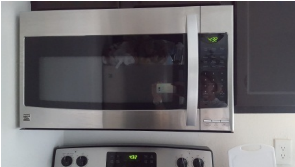
Микроволновка совмещённая с вытяжкой

Большие уличные кондиционеры размещены прямо под окнами и очень, очень сильно шумят, особенно мешают ночью.