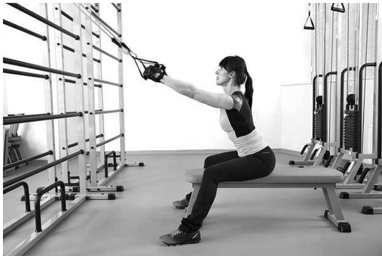
Фото 9 а