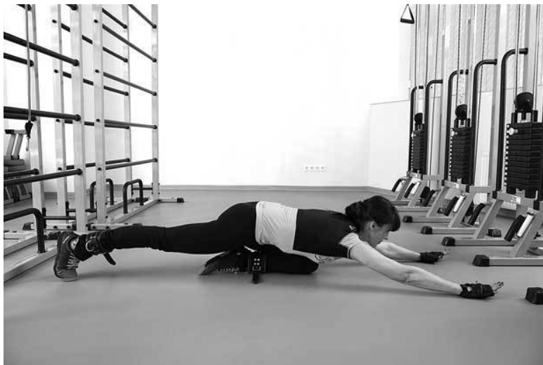
Фото 1 б

Для начала я рекомендую освоить самое простое упражнение, о котором я рассказываю постоянно, – это ходьба на четвереньках при острой боли. Ходить надо долго, по 20–30 минут. Старайтесь делать шаги длинными и мягкими – как кошка, крадущаяся к птичке ( фото 1 а, б ). В этом положении отсутствует осевая нагрузка на позвоночник, то есть эти движения абсолютно безопасны. Очень важно следить за дыханием: чтобы снять нагрузку веса тела на ось позвоночника, каждое движение выполняется на выдохе «Ха-а».