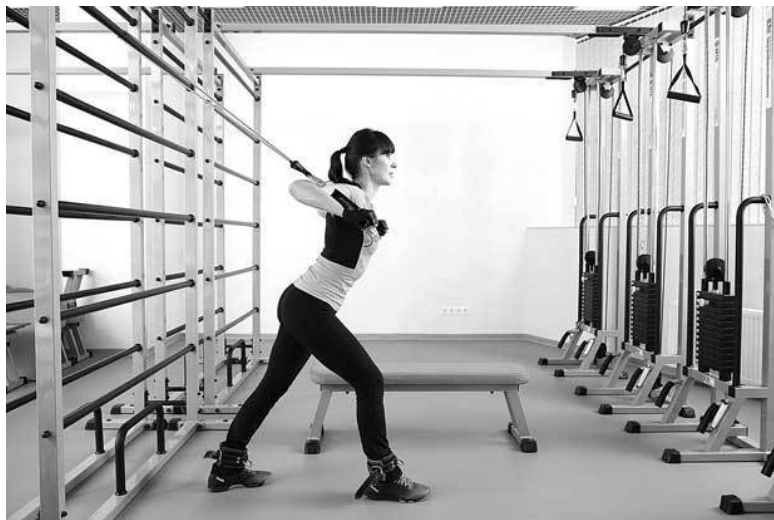
Φοτο 11 α