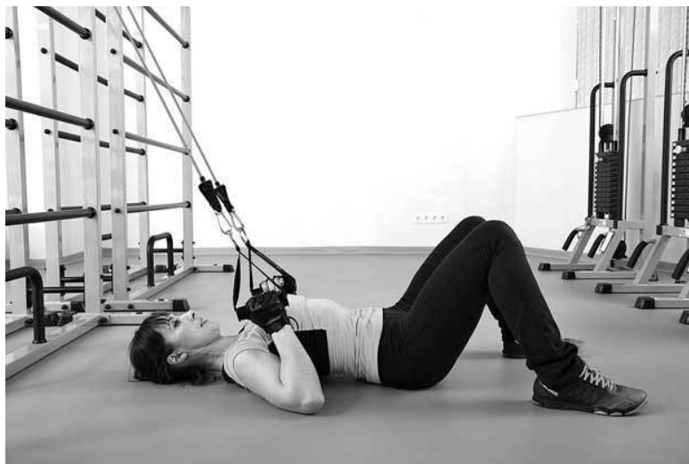
Фото 12 б

Например, можно делать следующее упражнение. Прикрепите резиновые бинты к неподвижной опоре (например, к ножке стола) и займите исходное положение: для этого нужно лечь на спину головой к опоре, а руки максимально вытянуть. Выполняйте тягу резинки к плечам. Постарайтесь полностью выпрямлять руки в крайней точке (фото 12 а, б). Это несложное упражнение поможет справиться с неприятными ощущениями в спине.