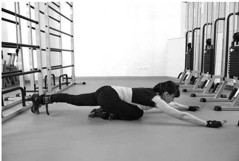
Фото 1 а

завершение физических упражнений ускорит выход из адаптивных болей в спине.