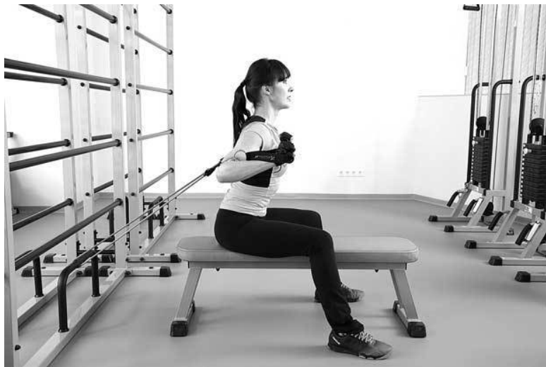
Фото 10 а