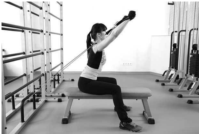
Фото 10 б