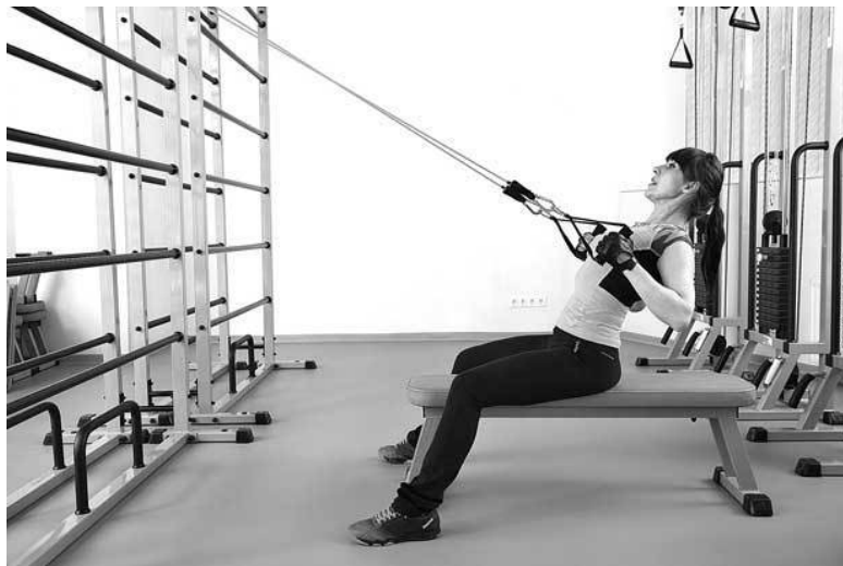
Фото 9 б