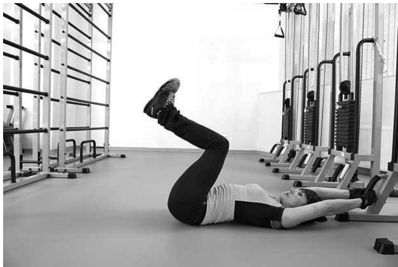
Фото 5 б