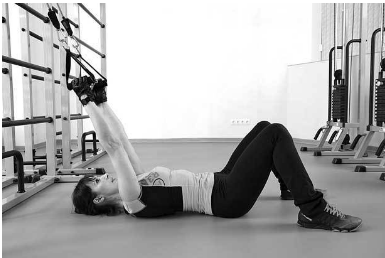
Фото 12 а

Скорее всего, такая травма является результатом остеопороза позвоночника. В своей книге «Секреты реабилитации, или Жизнь после травмы» я подробно описал все упражнения, которые будут полезны в подобных случаях. Пациентам, перенесшим серьезные травмы, я советую приобрести эту книгу и выполнять рекомендованные в ней упражнения.