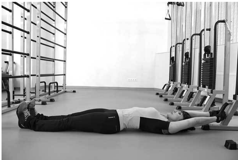
Фото 5 а