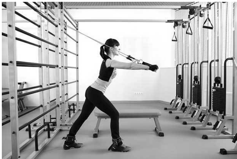
Фото 11 б

Третье упражнение. Прикрепить резиновый бинт к неподвижной опоре на высоте груди. Став спиной к опоре, поочередно выпрямляйте руки с резинкой вперед, как будто отжимаетесь ( фото 11 а, б ). Тело при жимах вперед следует слегка скручивать в грудном отделе.