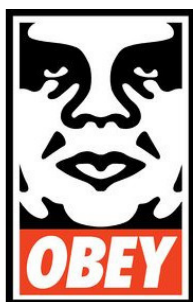
Andre the Giant