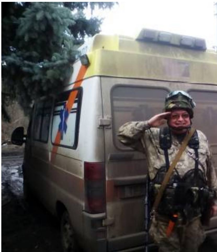
Офицерская рота (в учебке)