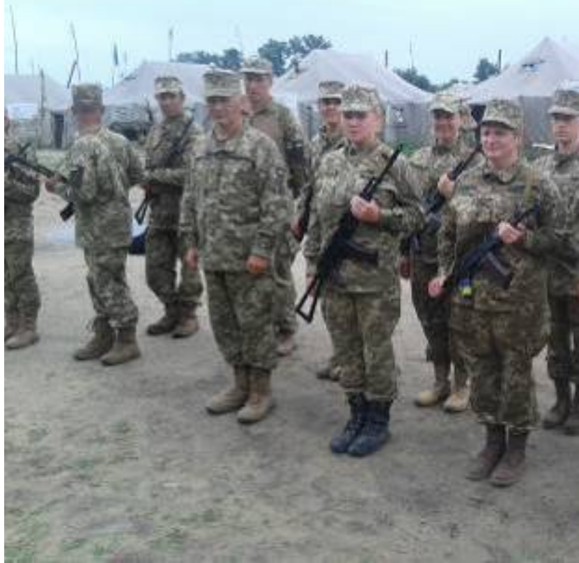
Присяга в части