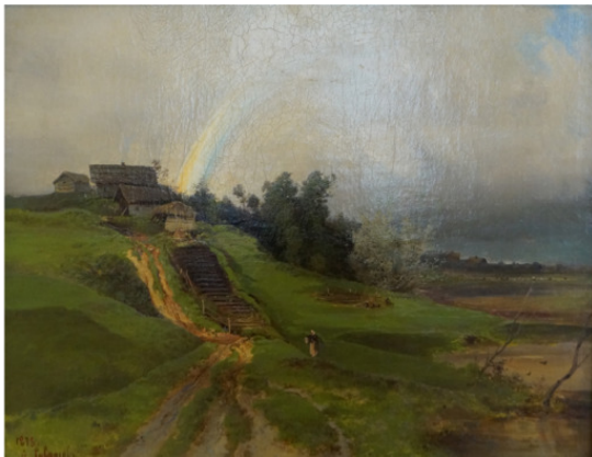
Изображение картины « Радуга ». А. К. Саврасов Государственный Русский музей

Не важно – в деревянном доме из оцилиндрованного бруса или нет живет человек – на счастье это не влияет, как и на ум (при этом можно быть гениальным конструктором). «Одаренный» – тот, кто имеет «дар» от «всеобъемлющего» и потому близок к пониманию его.