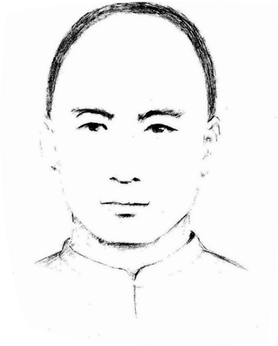
Сюань Чжаошань (1922–2000)