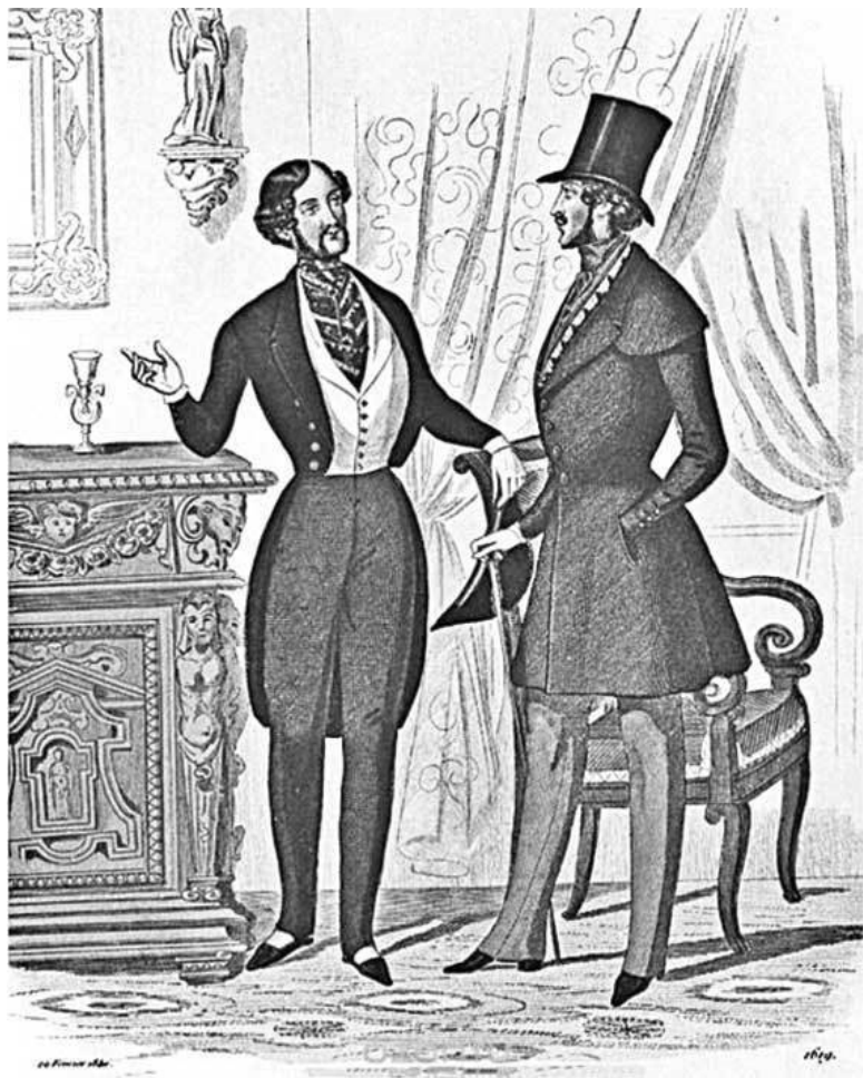
Джентльмены XIX века. Гравюра из модного журнала «Элегант». 1840-е гг.