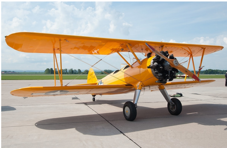
Fleet Model 2

Помимо военной контрабанды авиация противников пополнялась и более экзотическими способами. Так, первый действительно боееспособный истребитель Парагвая Savoia S.52 вообще прибыл в страну как демонстрационная модель, а гидроплан Savoia S.59, как исследовательский самолет. Это произошло в 1927 году. Транспортная авиация Боливии возникла 7 марта 1928 года после конфискации 3 учебных и 10 транспортных Юнкерсов (шесть F13 и четырех Ju-52) и