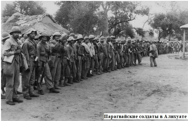
Парагвайские солдаты в Алихуате

Утром 8 декабря Эстигаррибия доложил президенту об освобождении Алихуаты. Тем временем передовые части дивизии Р.Франко достигли дороги Алихуата – Сааведра , где встретили патрули дивизии Х.А.Ортиса. В 11:00 Банцер прибыл на командный пункт 4 дивизии, где выяснил, что полковник Г.Квинт не имеет прямой связи с Сааведрой . Сообщение о соединении обеих дивизий у Кампо Виа легло на стол генерала Г.Кундта только в 16:00, который впервые признал положение на фронте очень серьезным. К этому времени всем стало ясно, что основные силы 4 и 9 боливийских дивизий оказались отрезаны от тылов I корпуса. Предусмат-