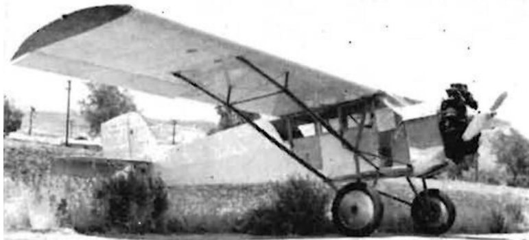
Curtiss Model 50 Robin (C-10)

В Чакской войне транспортная авиация Боливии превратилась в отдельный род войск. Причиной этого стала растянутость боливийских коммуникаций в начале войны. Для того, чтобы обеспечить себя необходимыми срочными грузами, Генеральный штаб Боливии еще до войны планировал иметь 20 транспортных самолетов. При этом боливийские военные опирались на опыт действий бомбардировочной авиации корпуса морской пехоты в США. Поэтому после объявления в 1928 году осадного положения весь парк ЛАБ, включавший 11 самолетов (6 гидропланов Ю-13, 4 Ю-52 и Форд 5-АТ-D), был мобилизован. В 1929 году два Ю-13 потерпели аварию, а остальные использовались для связи в бассейне Амазонки и Парагвая. К ним в 1934 году присоединился гидроплан Сикорского S-38В. Он был передан ВВС