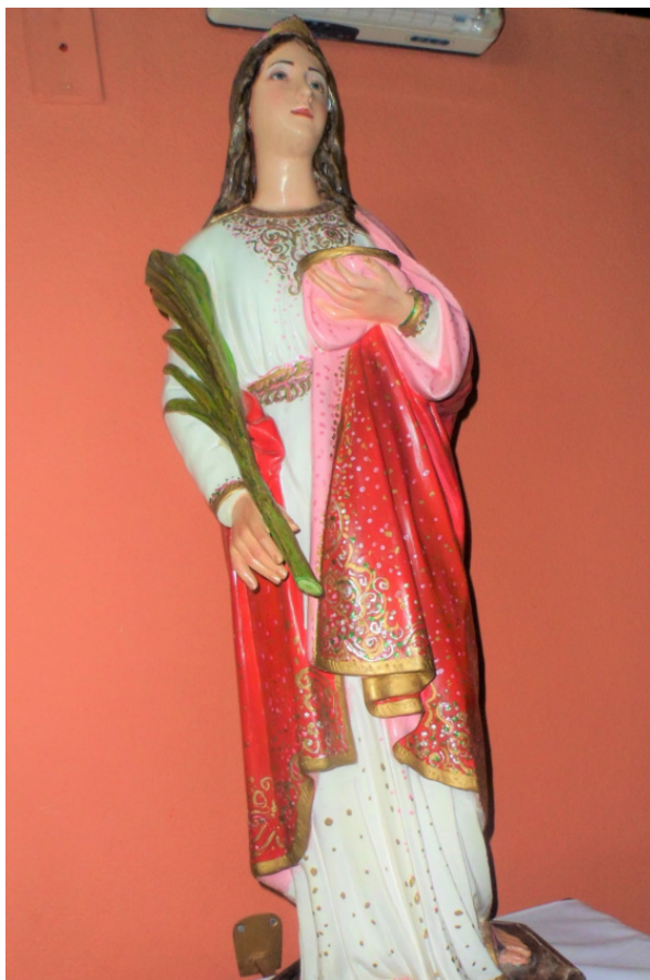
Изображение святой Лузии в церкви её имени в Белу-Оризонти