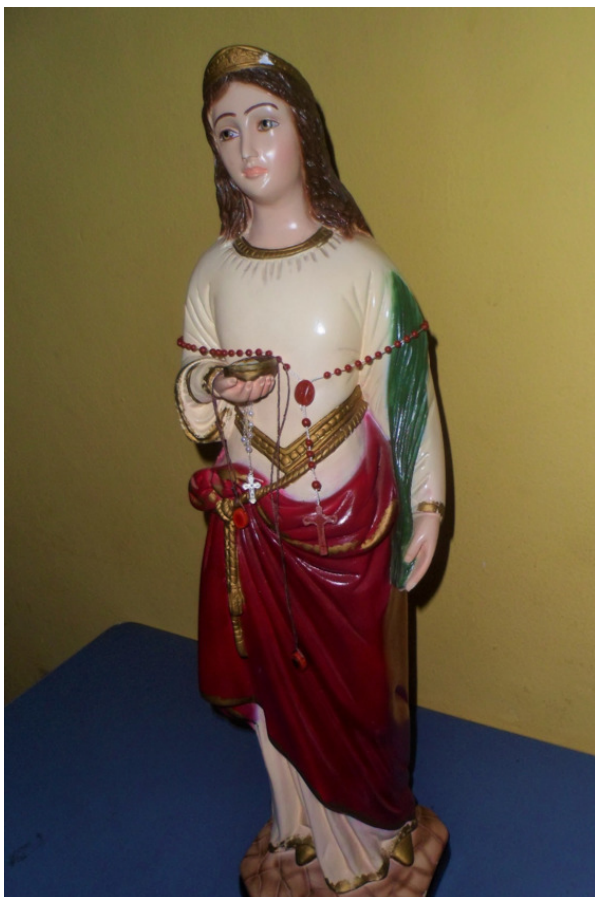
Изображение святой Лузитт из церкви её имени в Белу-Оризонти