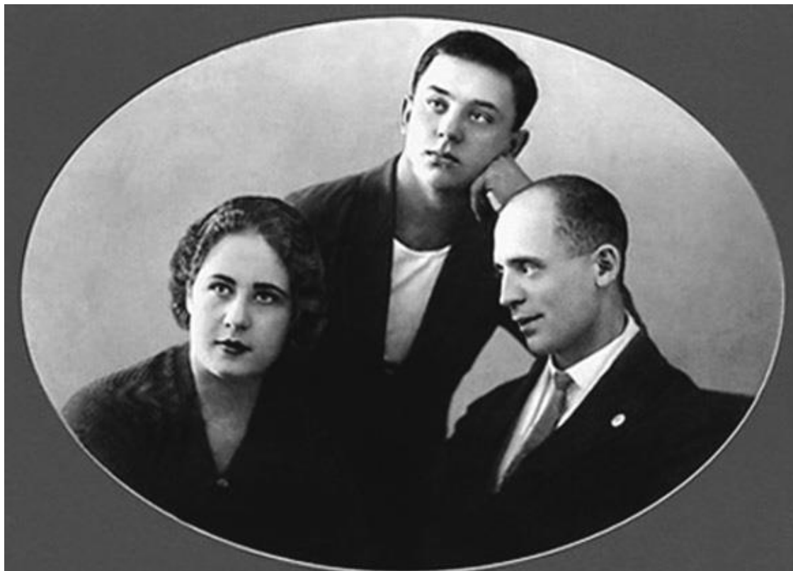
Вадим Козин с друзьями. Конец 1920-х

Вы спрашиваете, когда я стал профессионалом? Да, пожалуй, в 1924 году. Я тогда выдержал конкурс и поступил в Ленпосредрабис. Как расшифровать? Ленинградское посредническое бюро работников искусств. Поступил певцом-вокалистом. Не хухры-мухры! Бюро устраивало нас, певцов, не имевших постоянного места работы. Где я пел? В кинотеатрах. «Колосс» – был такой кинотеатр, «Гигант», как сейчас помню. Вот названия-то какие были.