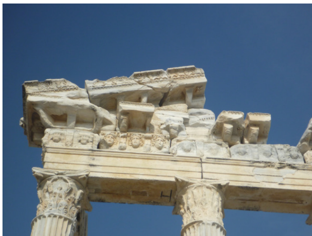
Храм Аполлона в Сиде.

Незаметно для себя подхожу к античному Сиде. Здесь остановилось само время, лишь дикие маки, растущие между полуразрушенных колонн, неторопливо покачивают на ветру своими изящными головками.