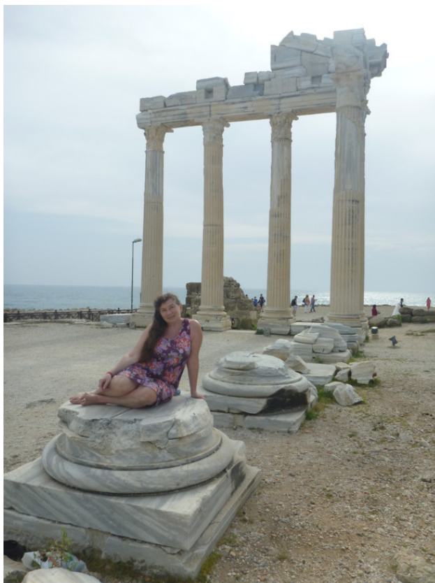
В античном Сиде.