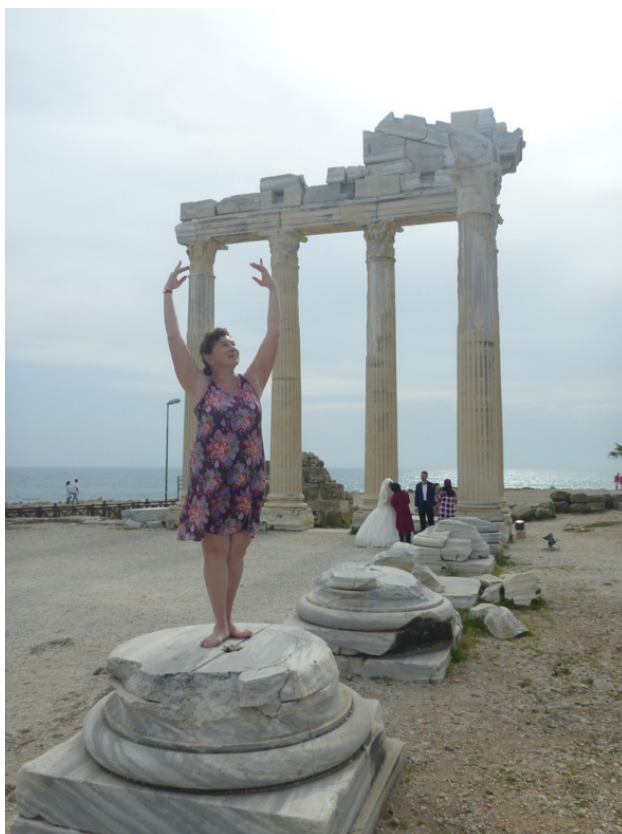
У храма Аполлона.

В этом году на майские праздники я решила снова слетать в свой любимый Сиде. В этом году тут было особенно тепло и уютно – без палящего солнца и толпы туристов, городок живет своей неторопливой жизнью. С утра так приятно побродить по зеленым, тенистым улочкам, понаблюдать как просыпается город и радуется новому дню. Одно за другим открываются кафешки – большие и маленькие, на два-три столика. Воздух напоен ароматами цветов и только что сваренного кофе. Не торопясь иду по набережной в сторону старого Сиде. Здесь особая аура, многовековая история и современность мирно уживаются бок о бок друг с другом.