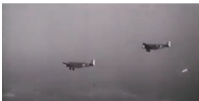
Кадры немецкой военной кинохроники 1941 года