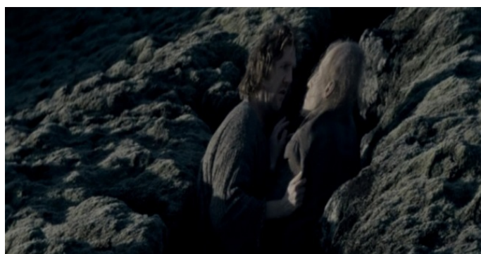
Кадр из фильма «Фауст»