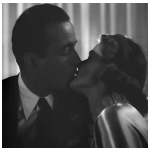
Кадр из фильма «Касабланка»