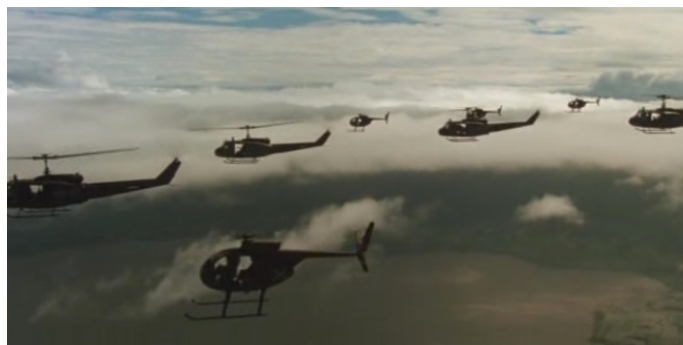
Кадры из фильма «Апокалипсис сегодня»