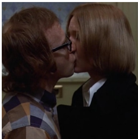
Кадр из фильма «Сыграй еще раз, Сэм»