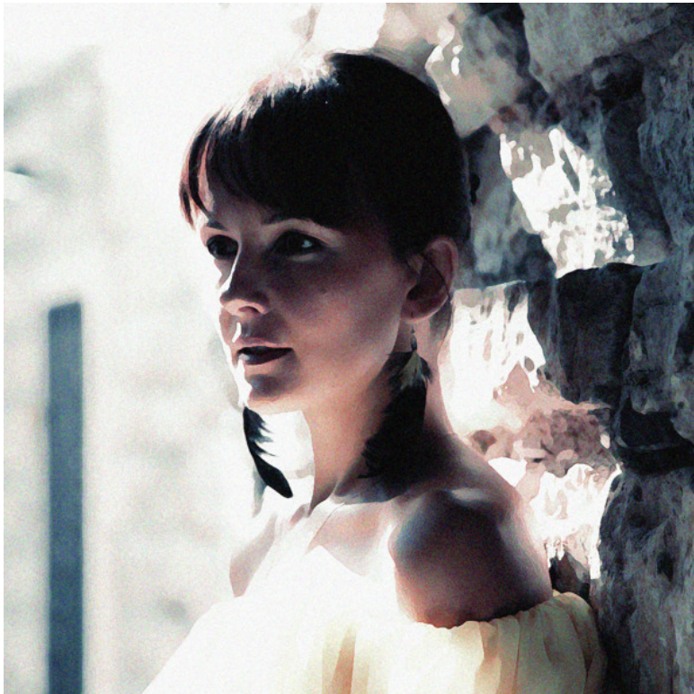
Арришка и загадочный замок