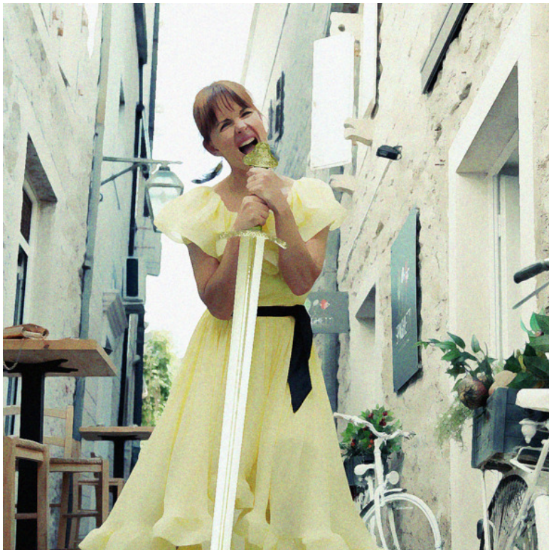
Арришка и клинок света