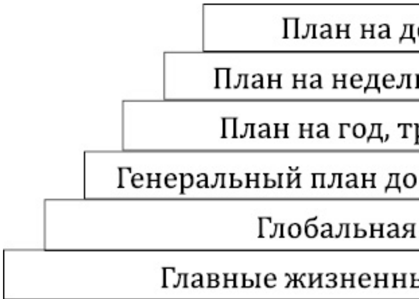
Рис. 6. Техника построения

Как мы видим из приведенных примеров, участницы арт-марафона смогли с помощью первого рисунка дать ответы на вопросы «Кто я? Где я?» и сформулировать свои цели. После чего они выявили необходимые ресурсы для достижения намеченных целей. Из их работ ясно, что произошла интеграция – взаимодействие ресурса и опыта.