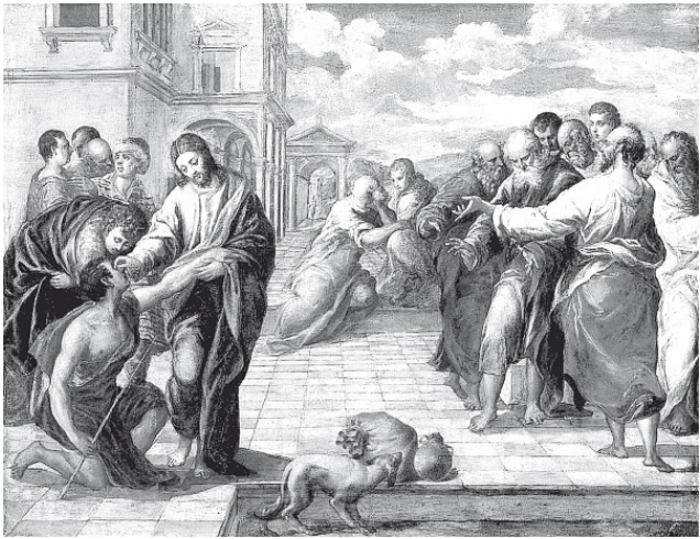
Jean-Christian Petitfils JÉSUS