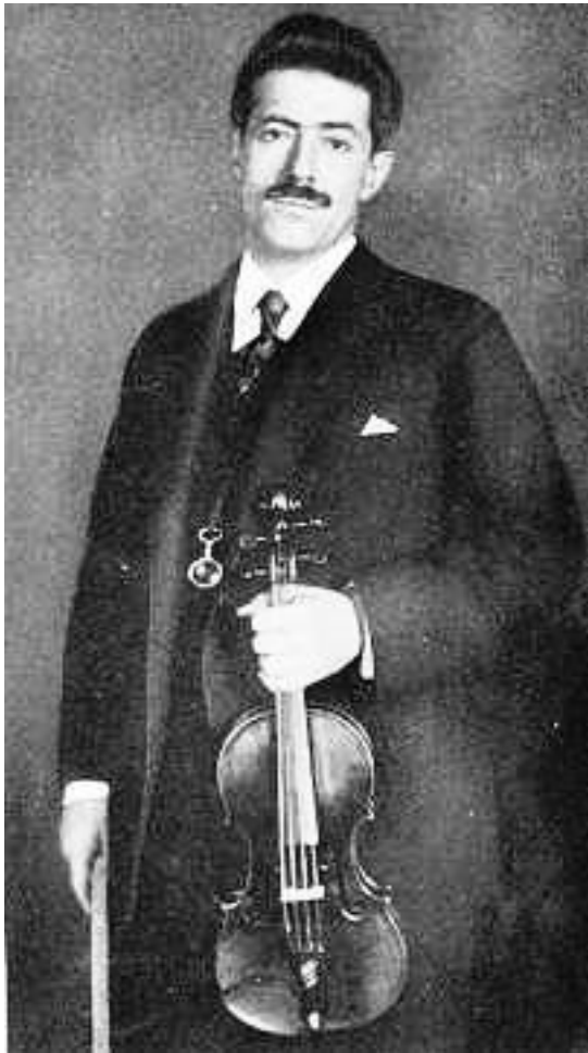
Фриц Крейслер в начале 1900-х годов