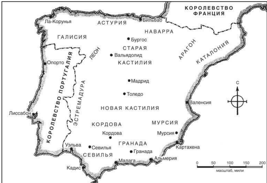
Карта 1. Королевства Испании в конце XV века

ния впервые за много веков оказалась под властью христианских монархов. Территория Гранады была отдана под управление Кастилии.