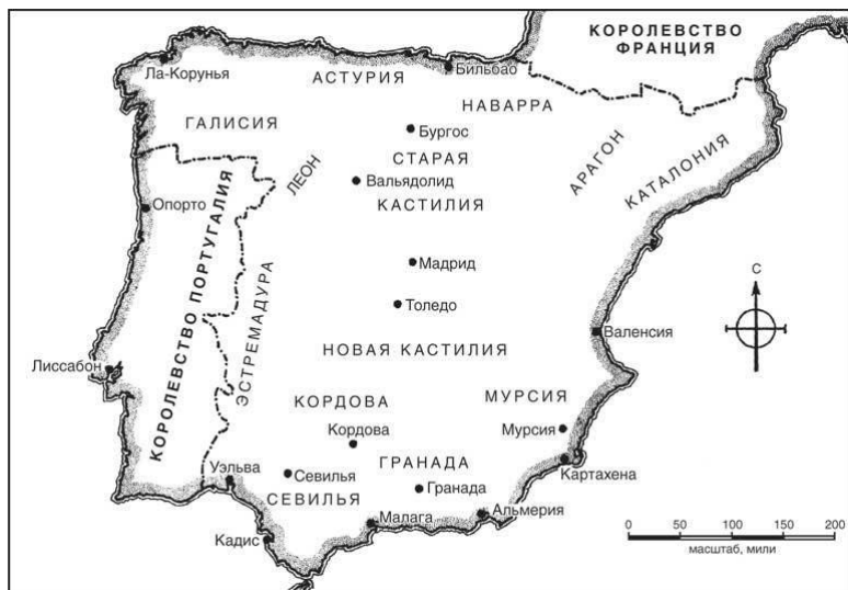
Карта 1. Королевства Испании в конце XV века

ми, чем их испанские конкуренты), и, наконец, политические опасения – внушаемые не столько Гранадой, сколько мощной поддержкой, которую Гранадский эмират может получить от других мусульманских стран, если ее не привести под власть христиан. Что касается самого эмирата, изолированного и разделенного изнутри, исход войны никогда не подвергался серьезным сомнениям. Столица эмирата Гранада сдалась в 1492 году. Вся Испания впервые за много веков оказалась под властью христианских монархов. Территория Гранады была отдана под управление Кастилии.