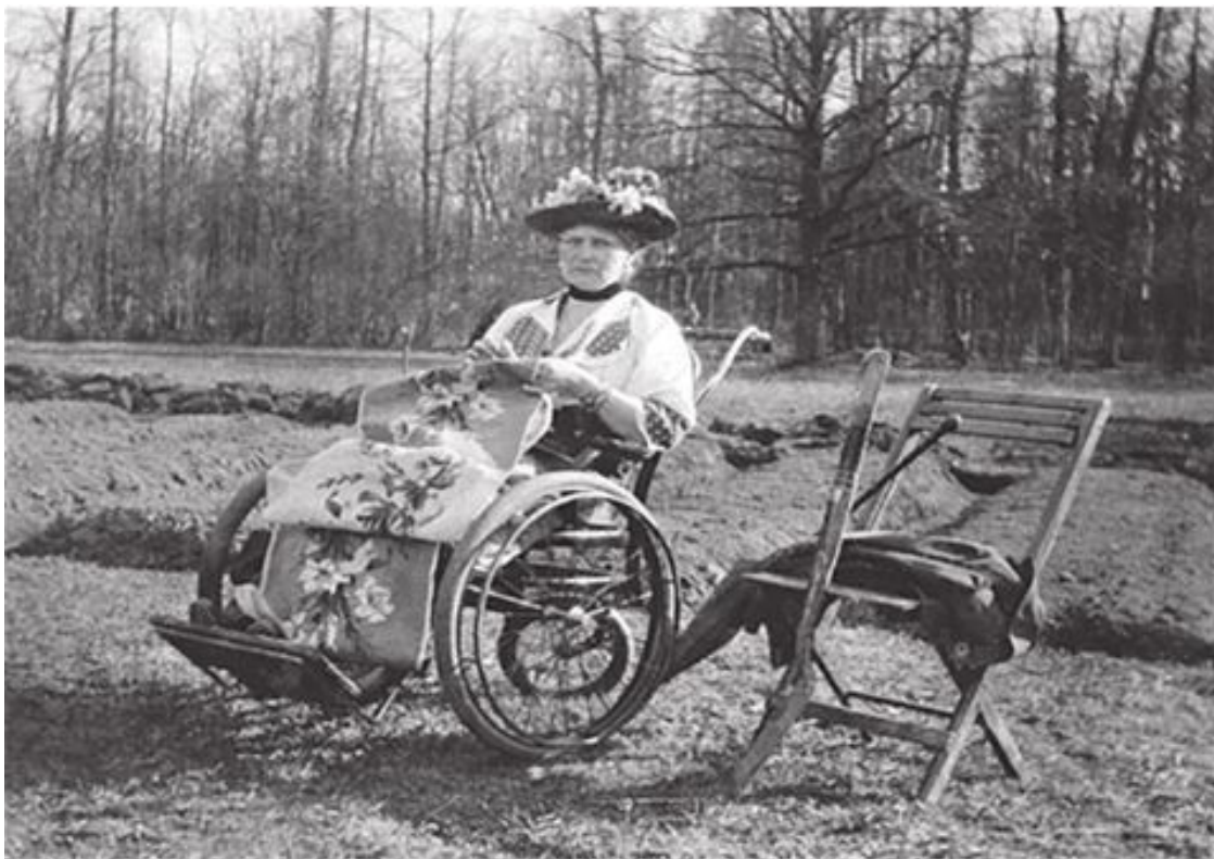
Романова Александра Федоровна в Тобольске