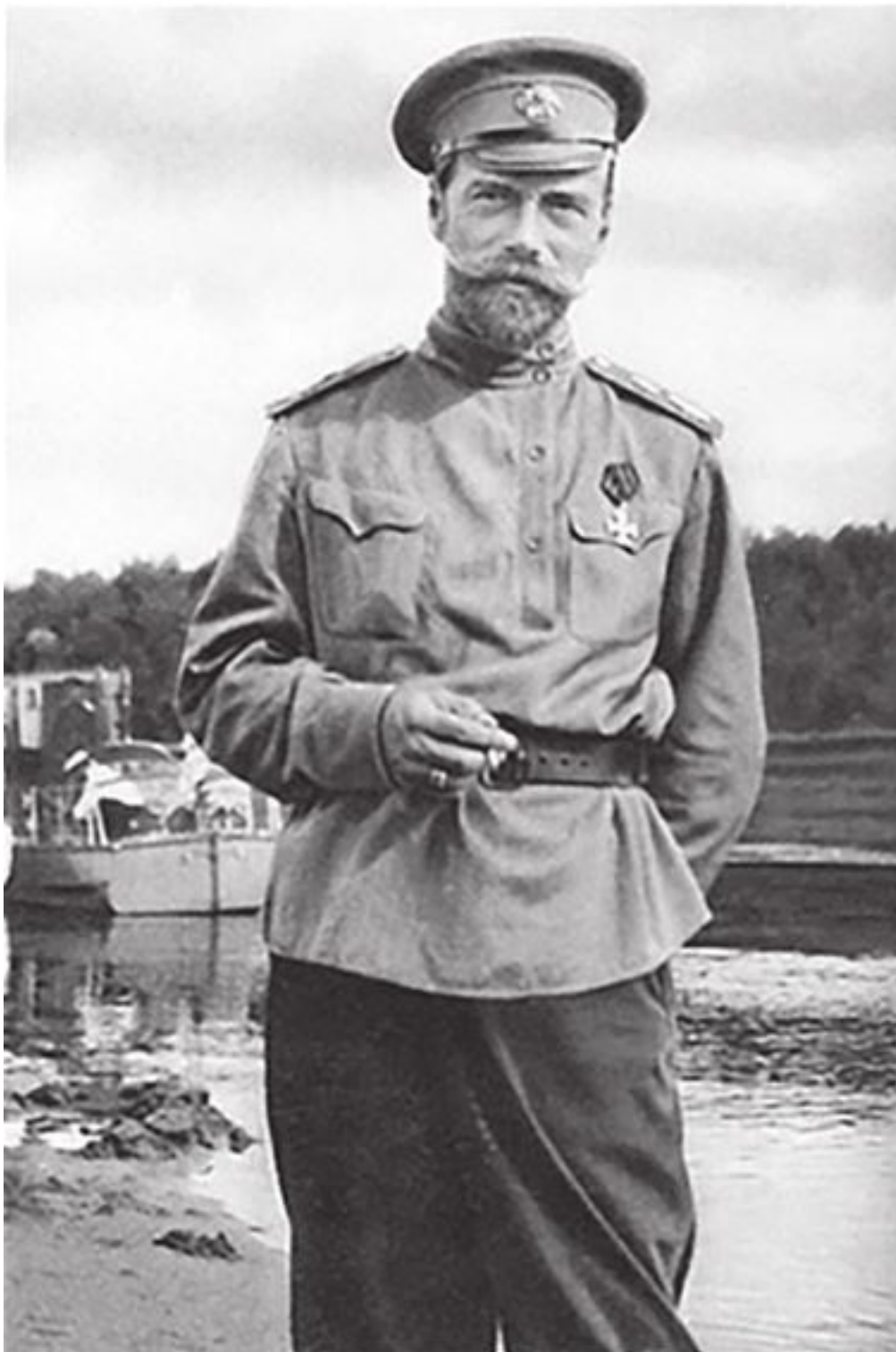
Император Николай II. Фотография 1915 г.

Более того: оказавшись один на один с властью, думцы, сформировавшие Временное правительство, очень быстро поняли, что закладываемый вираж для них слишком крут. Они ведь были вовсе не за республику, в которой получают всю полноту власти, а за более или менее конституционную монархию – как в Англии, свете очей большинства тогдашней «элиты». Известный думец Шульгин писал: «Мы были рождены и воспитаны, чтобы под крыльшком власти хвалить ее или порицать. Мы способны были в крайнем случае пересесть с