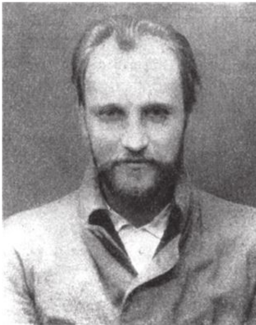
Войков Пётр Лазаревич