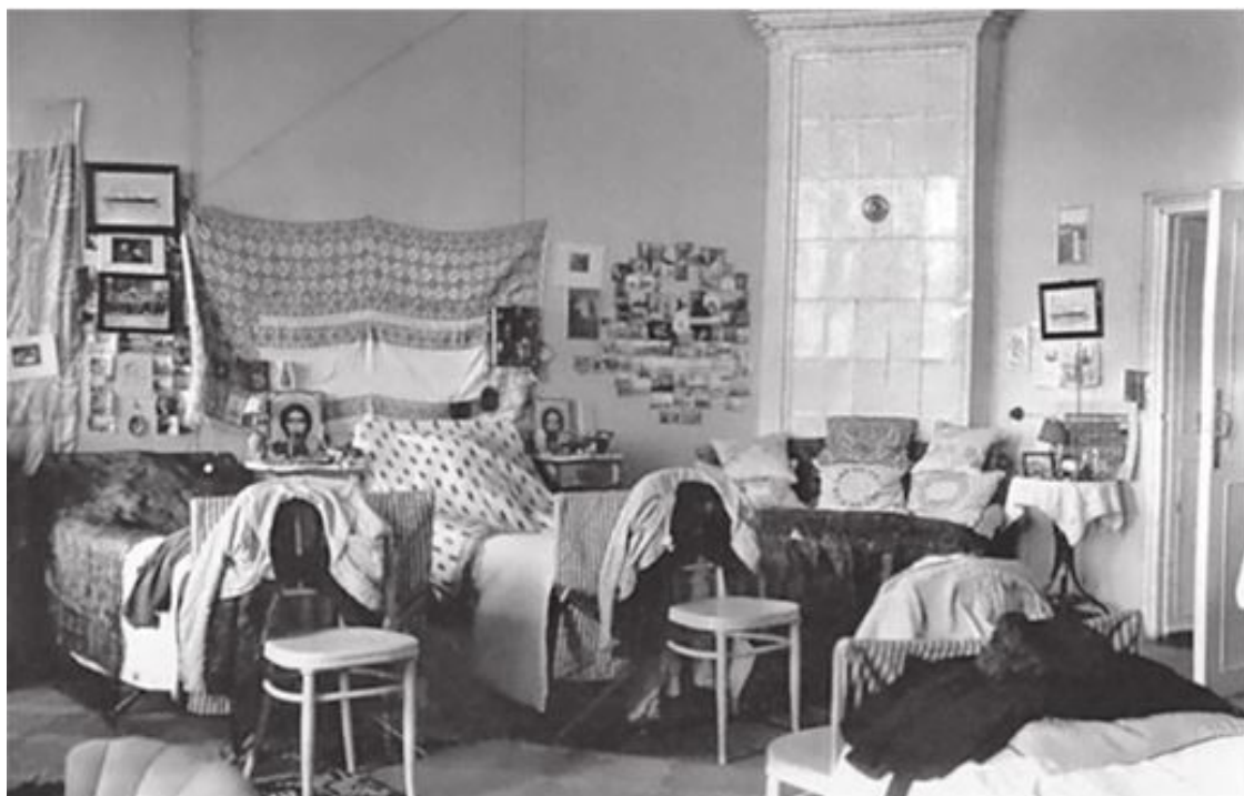
Комната великих княжон в губернаторском доме в Тобольске

Цесаревич Алексей, находясь в Тобольске, записал в своем дневнике: «Скучно. Сегодня, как вчера, завтра – как сегодня... Господи, помоги нам! Господи, помилуй!» Распилить дрова с отцом – чем не средство от скуки?