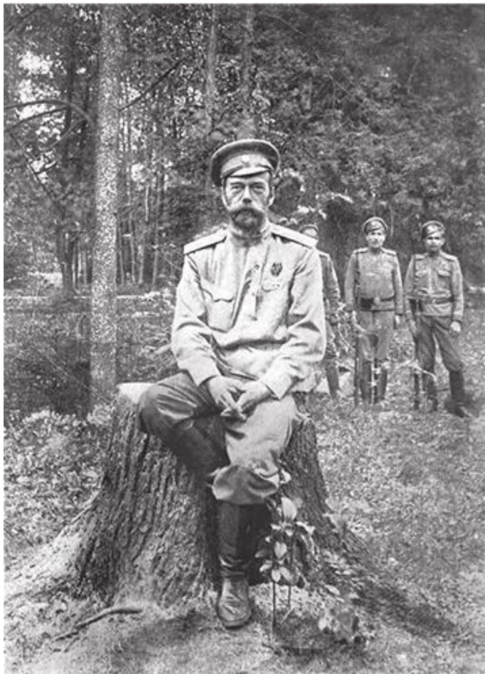
Николай II в ссылке в Тобольске