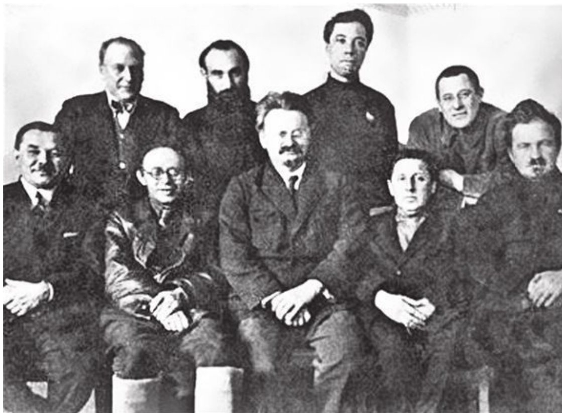
Александр Белобородов среди лидеров левой оппозиции. Сидят (слева направо): Леонид Серебряков, Карл Радек, Лев Троцкий, Михаил Богуславский и Евгений Преображенский; стоят: Христиан Раковский, Яков Дробнис, Александр Белобородов и Лев Сосновский. 1927 г.

Выполнение постановления поручалось Юровскому, как коменданту ипатьевского дома. При выполнении должен был присутствовать, в качестве делегата областного комитета партии, Войков. Ему же, как естественнику и химику, поручалось разработать план полного уничтожения трупов. Войкову поручили также прочитать царскому семейству постановление о расстреле, с мотивировкой, состоявшей из нескольких строк, и он действительно разучивал это постановление наизусть, чтобы прочитать его возможно более торжественно, считая, что тем самым он войдет в историю, как одно из главных действующих лиц этой трагедии. Юровский, однако желавший также «войти в историю», опередил Войкова и, сказав несколько слов, начал стрелять... Почти одновременно начали стрелять все остальные, и расстреливаемые падали один за другим, за исключением горничной и дочерей царя. Дочери продолжали стоять, наполняя комнату ужасными воплями предсмертного отчаяния, причем пули отскакивали от них.