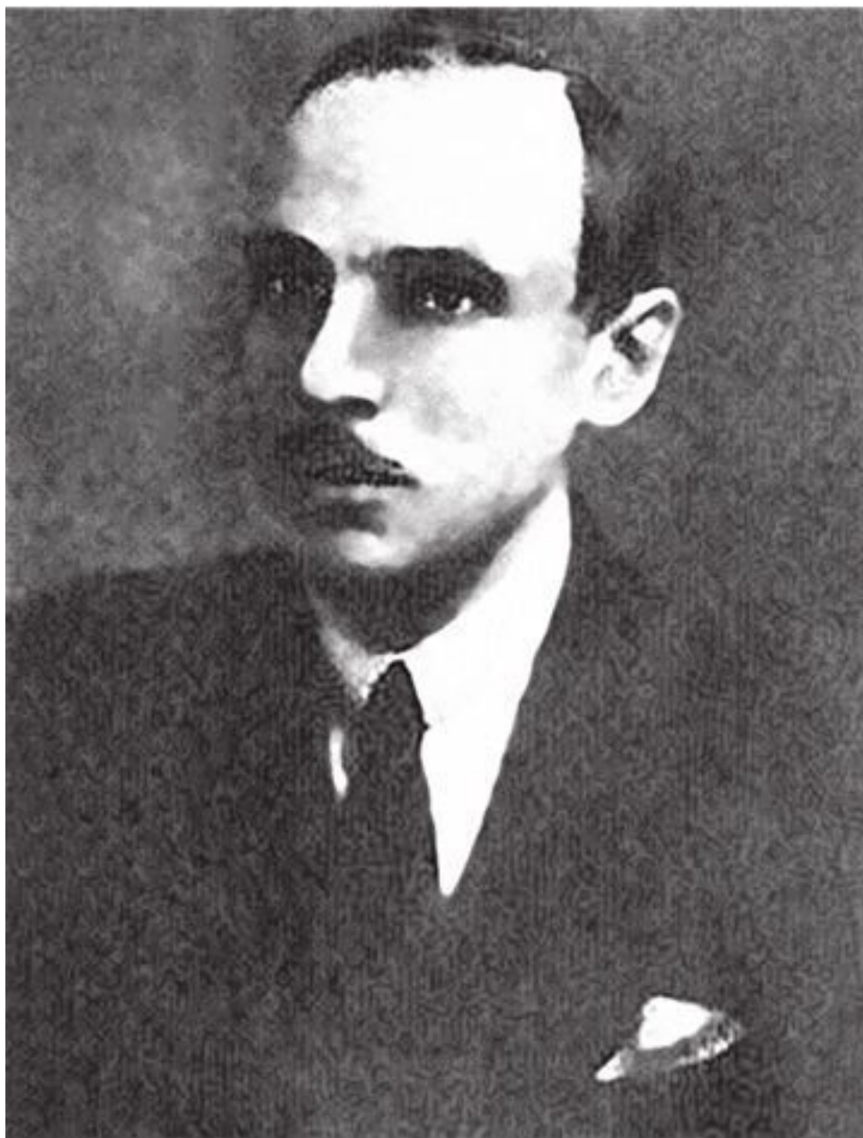
Следователь Н.А. Соколов