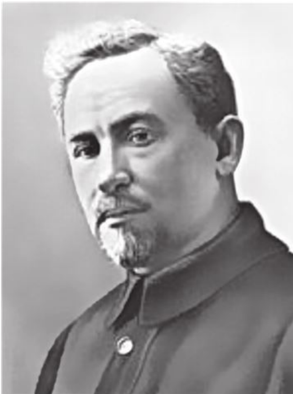
Голощёкин Филипп Исаевич

Уничтожение трупов началось на следующий же день и велось Юровским под руководством Войкова и наблюдением Голощекина и Белобородова... Войков вспоминал эту картину с невольной дрожью. Он говорил, что, когда эта работа была закончена, возле шахты лежала громадная кровавая масса человеческих обрубков, рук, ног, туловищ и голов. Эту кровавую массу поливали бензином и серной кислотой и тут же жгли двое суток подряд... Это была ужасная картина, – закончил Войков. – Мы все, участники сжигания трупов, были прямо-таки подавлены этим кошмаром. Даже Юровский, и тот под конец не вытерпел и сказал, что ещё таких несколько дней – и он сошел бы с ума...» 1 .