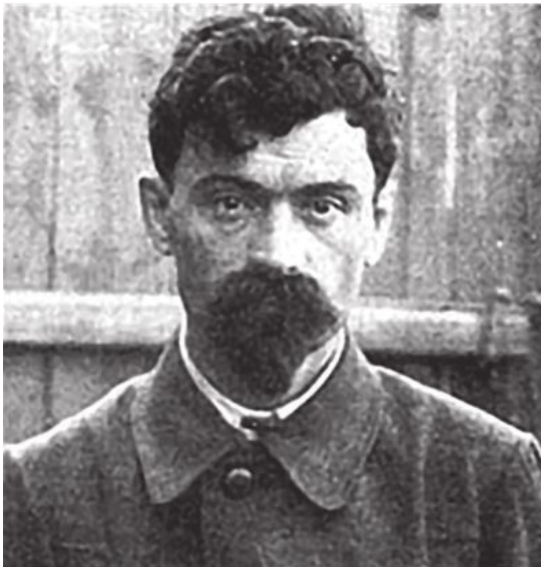
Юровский Яков Михайлович Юровский, комендант дома Ипатьева с 4 июля 1918 года