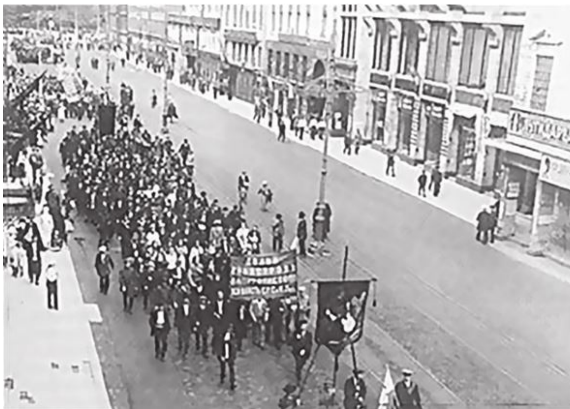
Июльская демонстрация в Петрограде, 1917 г.