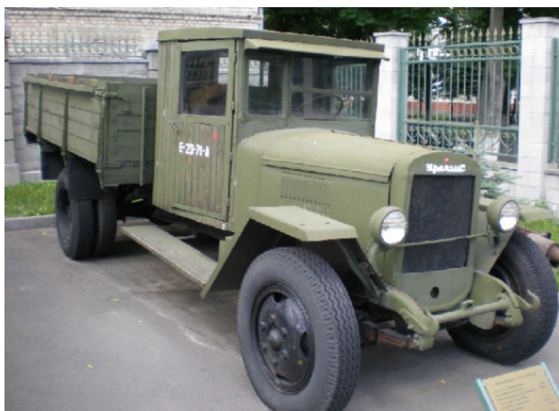
ЗИС-5, легендарный отечественный грузовой автомобиль

Иван Лихачев. Рождение – 1896 г., с. Озерцы Тульской области...окончание сельской школы, работа слесарем на Путиловском заводе... во время Первой мировой войны – служба матросом на Балтийском флоте. С 1917 по 1921 гг. Лихачев – командир в частях РККА, и даже работник ВЧК. Далее – учеба в Горной академии и Ленинградском электромеханическом институте. Получение слишком многих, не всегда применимых на практике познаний претит будущему Народному Комиссару. Он оставляет ВУЗ и, по велению коммунистической партии, возглавляет Московский автомобильный завод (1926). Завод основан в 1916 г., до окончательного становления Советской власти успел выпустить около 1300 автомобилей «Фиат». Первое достижение МАЗ в СССР – выпуск в ноябре 1924 г. десяти полутоннажных грузовиков АМО-Ф-15. Интересно, что конвейерный «американец», даже с доставкой в страну Советов из-за океана, стоит в десять раз дешевле его, изготовленного на стапелях отечественного аналога.