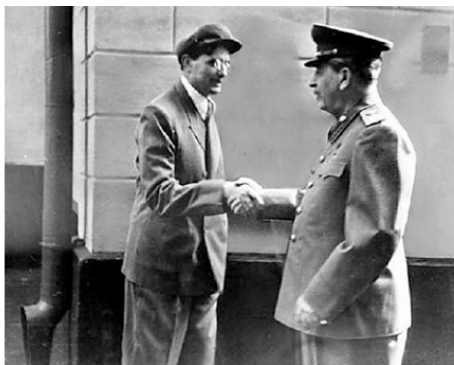
Михаил Суслов и Иосиф Сталин, 1949 г.

...Не принимаются во внимание также и доводы маршала Н. Огаркова, начальника Генштаба СССР, резко протестующего против ввода советских войск в Афганистан. В конце концов, государство, организм которого не предусматривает реакций самодовольного мозга на сигналы рецепторов, перестает совершать осмысленные действия, и распадается.