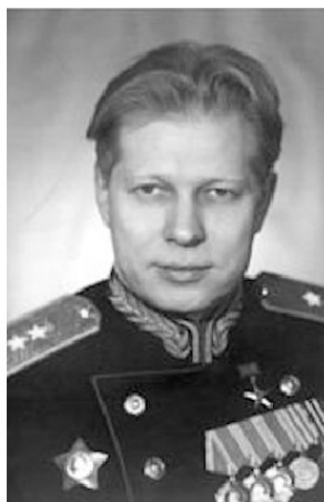
Дмитрий Устинов, фотография 1950-х годов