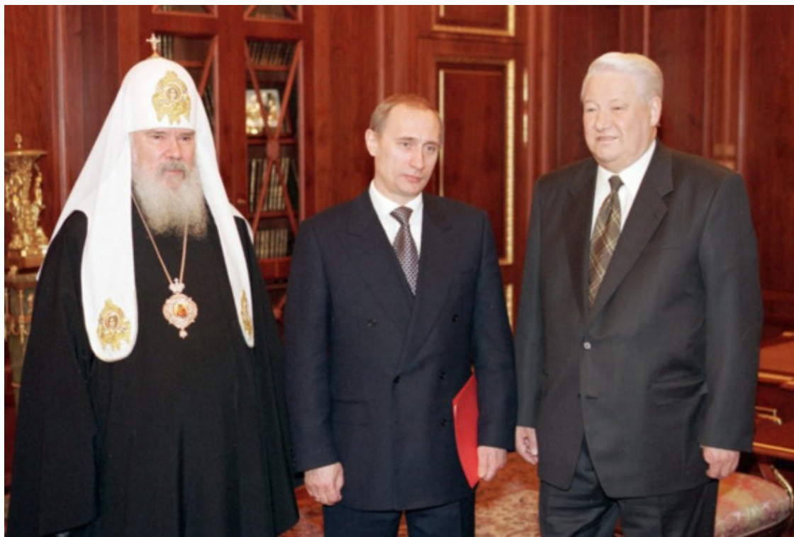
Слева направо: 1. Борис Ельцин 2. Владимир Путин 3. Алексей Второй, фото 1999 г.