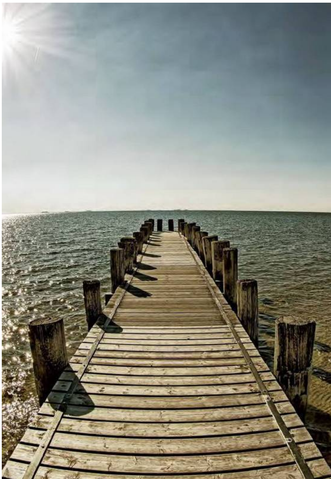
Фёр – один из Фризских островов, залитый волшебным светом.