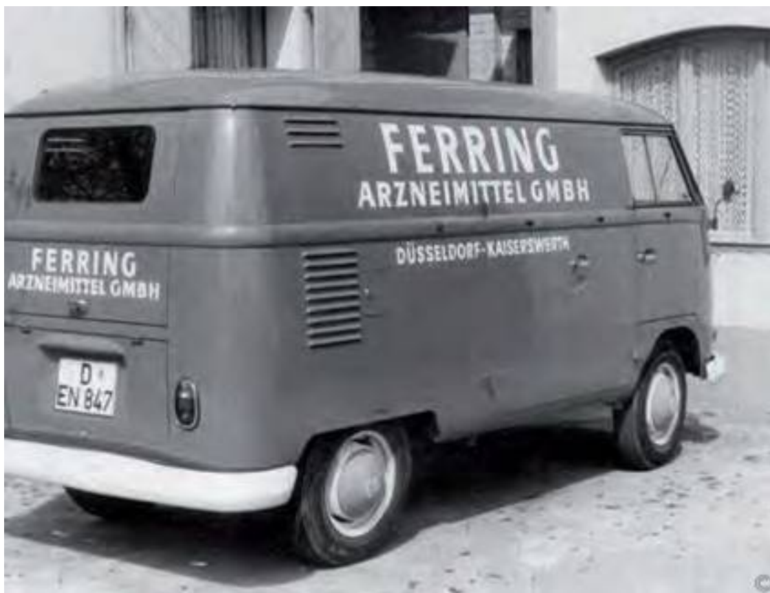
Германия, 1960-е. Первые шаги международной компании.