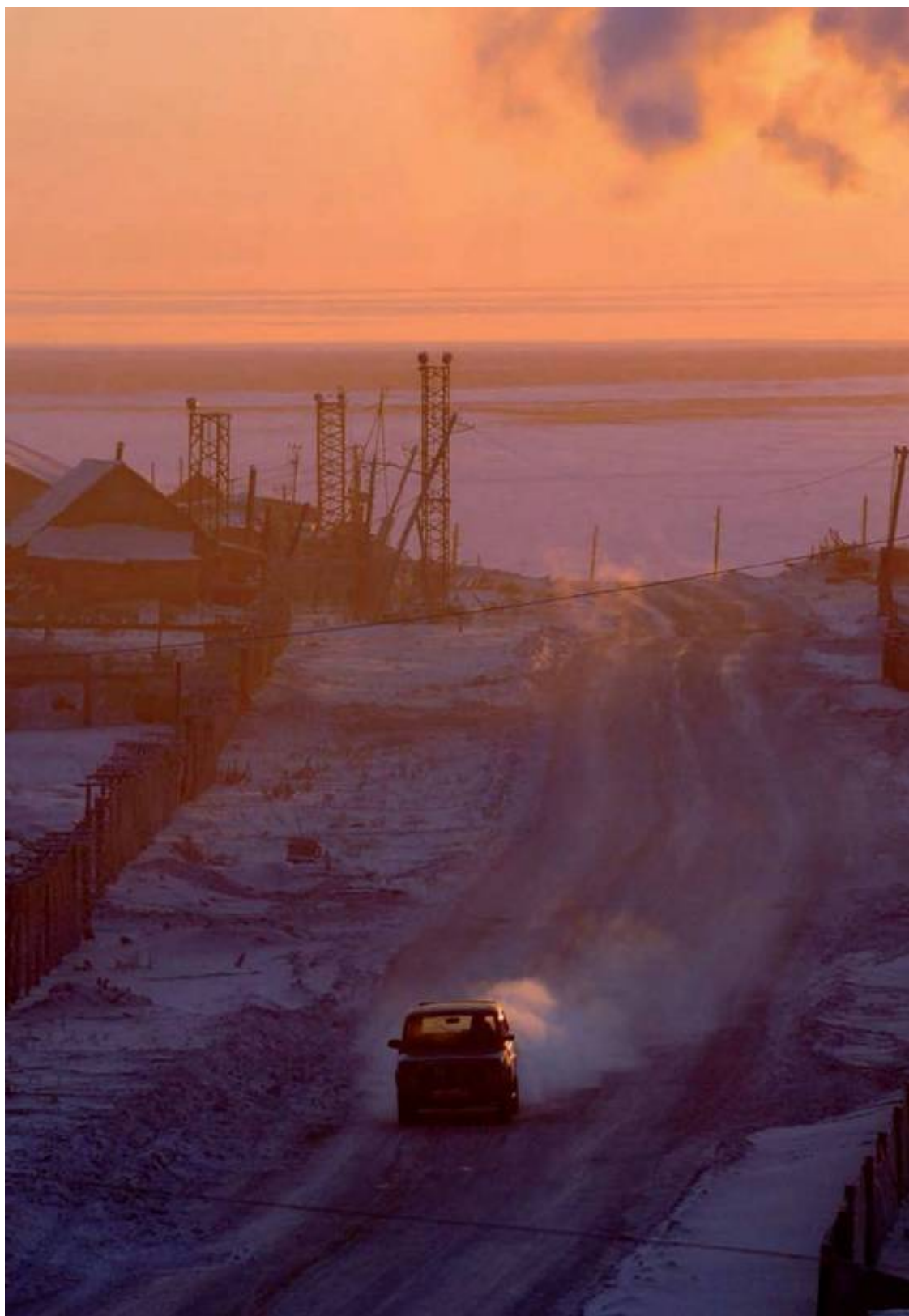
Хатанга, январь. Солнце вновь появляется над горизонтом после двух месяцев полярной ночи.