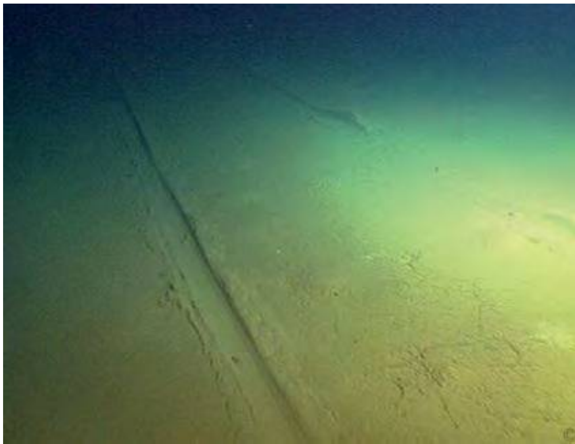
Следы батискафа на илистом дне настоящего Северного полюса, на глубине 4302 метра.

Долгое время развитие технологий было единственным ключом к исследованию Северного полюса. Если согласиться с мнением большинства специалистов, что Роберт Пири обманул весь мир, заявив о достижении Северного полюса в 1909 году, то получится, что в первый раз человек добрался до этого места благодаря дирижаблю «Норвегия», пролетевшему над ним 13 мая 1926 года. 1 Первыми, кто совершенно неопровержимо ступил на льды Северного полюса, стали советские граждане – члены высокоширотной воздушной экспедиции «Север-2» под руководством Александра Кузнецова, прибывшие на трех самолетах 23 апреля 1948 года. Американская атомная подводная лодка «Наутилус» прошла над полюсом 10 лет спустя, потом подводная лодка «Скат» вышла на поверхность, разломав толщу молодого льда. 2 Без помощи техники Северный полюс удалось достичь лишь 5 апреля 1969 года. Именно тогда Уолли Герберт и его товарищи направили к нему собачьи упряжки... всего за три месяца до того, как «Аполлон-11» высадил Армстронга и Олдрина на Луну!