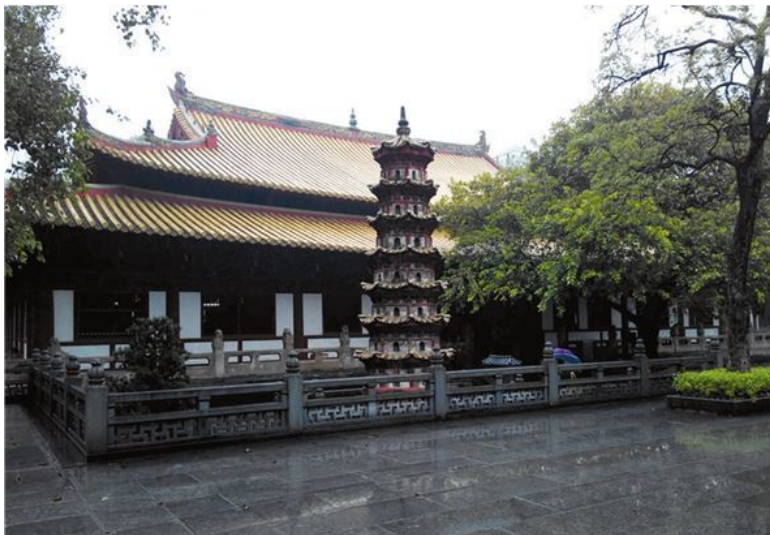
Пагода Ифа. Гуанчжоу

Я стою перед пагодой Ифа. Она такая миниатюрная, что, казалось бы, можно взять её с собой и унести домой. Под ней, по преданию, погребены волосы шестого патриарха чань-буддизма Хуэйньэна. Много лет назад, будучи первокурсником, я читал его «Сутру помоста». Теперь я живу неподалёку. Когда-то давно я мечтал найти Китай Хуэйньэна, Китай мудрецов и искателей истины. Но найду ли я его?