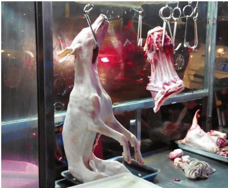
Туша собаки в ресторане. Дунгуань

Гуляю я как-то по парку. Рядом со мной приземляется горлица. Складывает крылья. Не успевает она пройти и пару шажков, как тут же рядом притормаживает мотоциклист, моментально откручивает птице голову, приторачивает её к поясу и уезжает. А наблюдающий эту картину охранник парка ему ещё так приветливо машет.