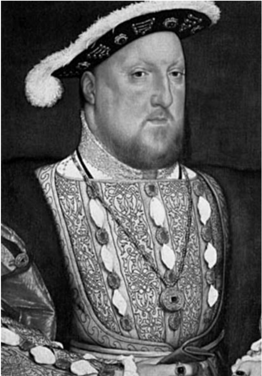
Рис. 7. Генрих VIII

недомогания и диету, но и слабости и силу вашего тела, а также другие качества и средства, которые, говоря кратко, необходимы, чтобы поправить ваше здоровье».