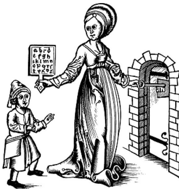
Рис. 1. Мудрость, держащая хорнбук и открывающая дверь в Знание ученику

сохранились до наших дней, собирались рыцари Круглого стола во главе с королем Артуром – главным героем британского эпоса и рыцарских романов.