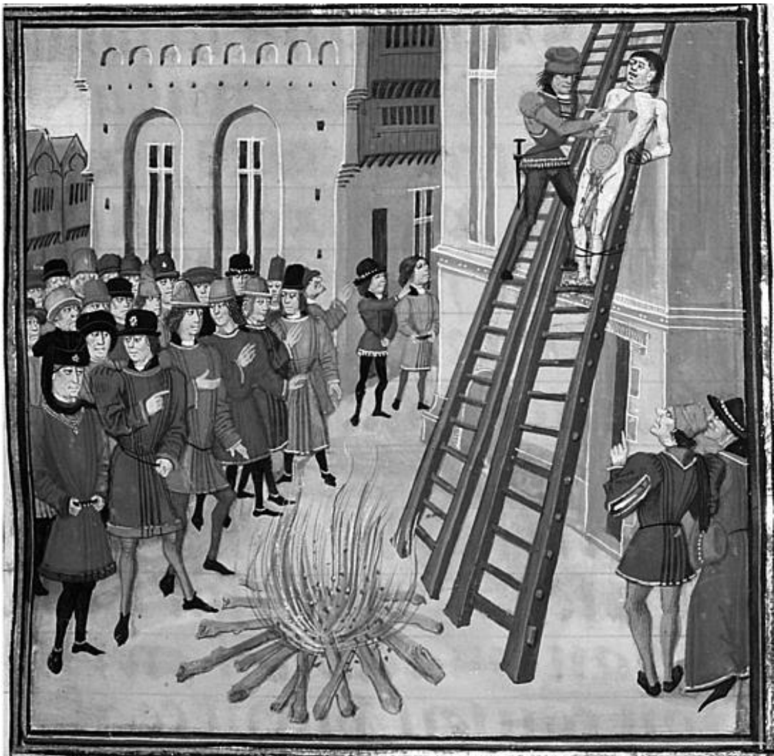
Рис. 8. Казнь «потрошением»

Меньше через месяц после казни Джона Хоутона «со товарищи» настала очередь следующих трех лондонских монахов. Затем, 11 мая 1537 года, четырех монахов из разных английских монастырей повесили умирать на зубцах городской стены Йорка. Палачи были неистощимы на выдумку, и 29 мая того же года большую группу лондонских картезианцев отправили в тюрьму Ньюгейт: их сковали цепями в положении стоя, руки привязали к столбам, находившимся за их спиной, и так оставили умирать от истощения. Последний из обитателей лондонского монастыря был «повешен, выпотрошен и четвертован» 4 августа 1540 года, но еще раньше, в ноябре 1538 года, лондонский Дом прекратил существование, а много лет спустя все невинно убиенные монахи были признаны святыми католической церкви.