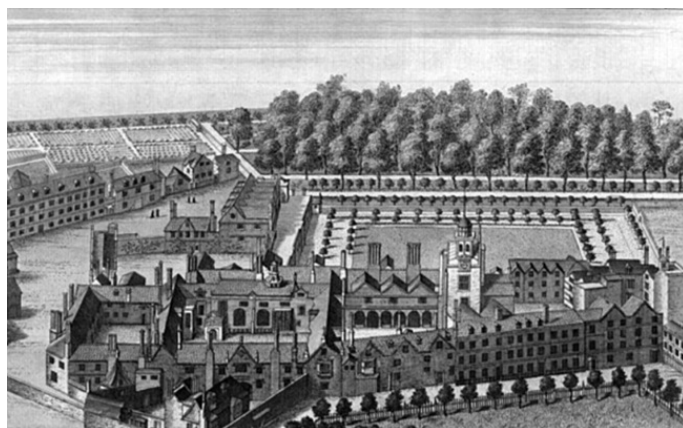
Рис. 6. Чартерхаус

Первый английский картезианский монастырь или Чартерхаус (англизированное Chartreuse ) возник в 1181 году по распоряжению короля Генриха II Плантагенета (1133–1189) в деревушке Уитэм, графство Сомерсетшир. В конце XIV века такая же обитель была основана в Лондоне, в районе Смитфильд, и полностью именовалась как «Монастырь во славу Матери Божьей» (рис. 6).