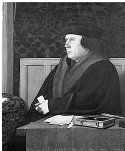
Рис. 9. Томас Кромвель

И тут ему на помощь неожиданно пришел Томас Кромвель! Этот человек сыграл значительную роль в жизни Борда, и поэтому нельзя не познакомить с ним читателя (рис. 9).