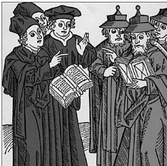
Рис. 3. Консилиум

Характерный пример приводит в одной из своих книг Ноэль дю Файль (ок. 1520–1591) 12 . Он рассказывает о консилиуме, в котором участвовало шесть ведущих докторов медицины из Сорбонны и великий итальянский врач, математик и философ Джироламо Кардано (1501–1576). Один из французских медиков путано и многословно, ссылаясь на авторитеты великих греков, арабов и евреев, излагал историю болезни и говорил так долго, что в середине рассказа забыл, с чего начал. Его сменил другой врач, которому коллеги помогали репликами. В течение всего этого словоизлияния Кардано молчал и оставался совершенно спокойным, лишь изредка кивая головой в знак согласия. Французы с нетерпением ждали «приговора» заезжего светила, а тот после некоторой паузы подвел итог высокоумного доклада своих коллег рекомендацией, сказанной почему-то не латынью, а итальянским: Ha besongna d'onno clystere (Поставьте ему клистир), и, вставая из-за стола, пробормотал: «Все эти педанты 14 ошибаются; я не доктор разговоров, я доктор действий» (рис. 3).