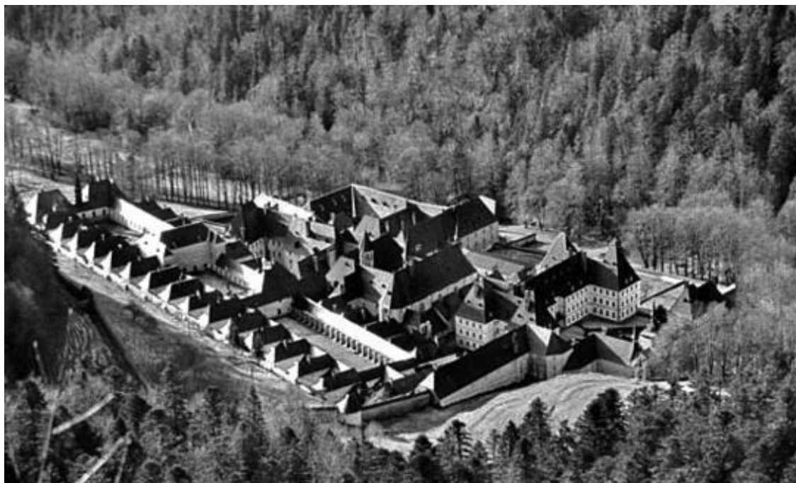
Рис. 5. Великая Шартреза

Бруно так определил главную цель своих единомышленников: «В тиши уединения, удаленные от всех, но в связи со всеми пребывающие, искать Бога, придя через эти искания к совершенной любви». Высшая власть в Картезианском ордене принадлежала Генеральному Капитулу, который созывался каждые два года. Между этими собраниями Орден возглавлял приор 15 , носивший титул «Преподобный Отец» (приоры же монастырей избирались Капитулами насельников самих обителей).