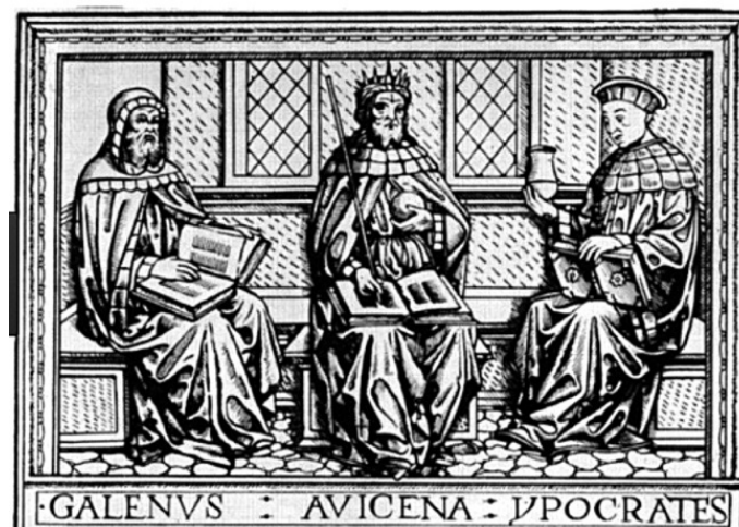
Рис. 2. Гален, Авиценна и Гиппократ

Наряду с гуморальной теорией, важную роль во врачебном деле играла астрология. Ее адепты утверждали, что сущность реальности состоит во взаимной зависимости земных и небесных материальных сил, а источником всего, что происходит на земле, является тепло (свет) и циклы движения небесных тел. Врачи-астрологи поддерживали концепцию возникновения заболеваний вследствие «разбалансированности» гуморов, но утверждали, что возникший дисбаланс зависит от определенного положения, Луны, Солнца, планет и других небесных объектов среди Знаков Зодиака.