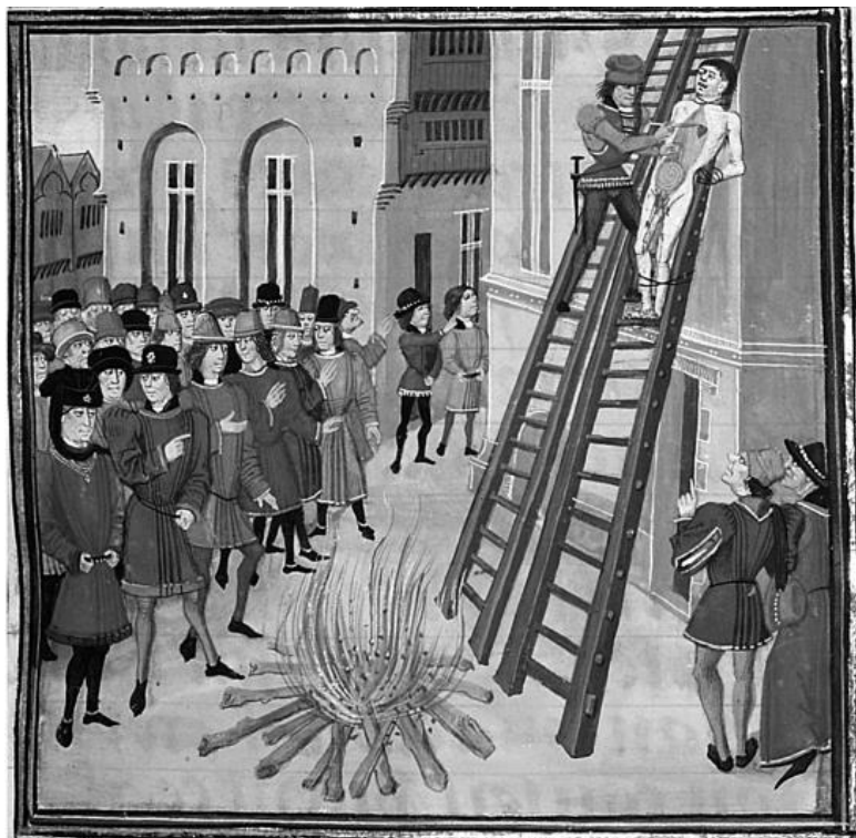
Рис. 8. Казнь «потрошением»

После смерти Хоутона место приора Чартерхауса оставалось вакантным. Среди тех, кто хотел бы его занять, был Эдмунд Хорд, который еще в начале сентября 1534 года счел необходимым письменно обратиться к королю с заверением