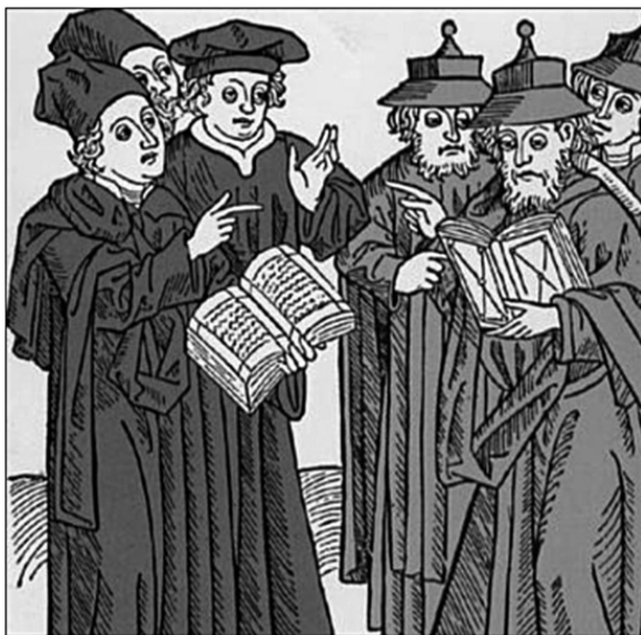
Рис. 3. Консилиум

совершенно спокойным, лишь изредка кивая головой в знак согласия. Французы с нетерпением ждали «приговора» заезжего светила, а тот после некоторой паузы подвел итог высокоумного доклада своих коллег рекомендацией, сказанной почему-то не латынью, а итальянским: Ha besongna d'onno clystere (Поставьте ему клистир), и, вставая из-за стола, пробормотал: «Все эти педанты 14 ошибаются; я не доктор разговоров, я доктор действий» (рис. 3).