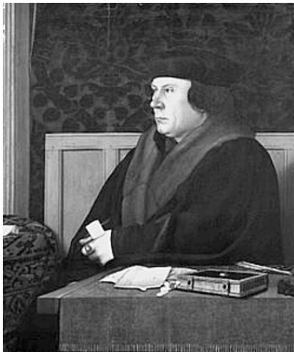
Рис. 9. Томас Кромвель

Внук кузнеца, сын пивовара и кабатчика, Томас Кромвель (ок. 1485–1540) рано покинул отчий дом и начал вести полную приключений жизнь в Англии и на континенте. Он служил наемником во французской армии, был банковским клерком в Италии, доверенным лицом английских купцов в Нидерландах, торговцем тканями, успешным лондонским адвокатом и, наконец, секретарем и правой рукой всемогущего Томаса Уолси (ок. 1473–1530), архиепископа Йорского, кардинала и Лорда-канцлера.