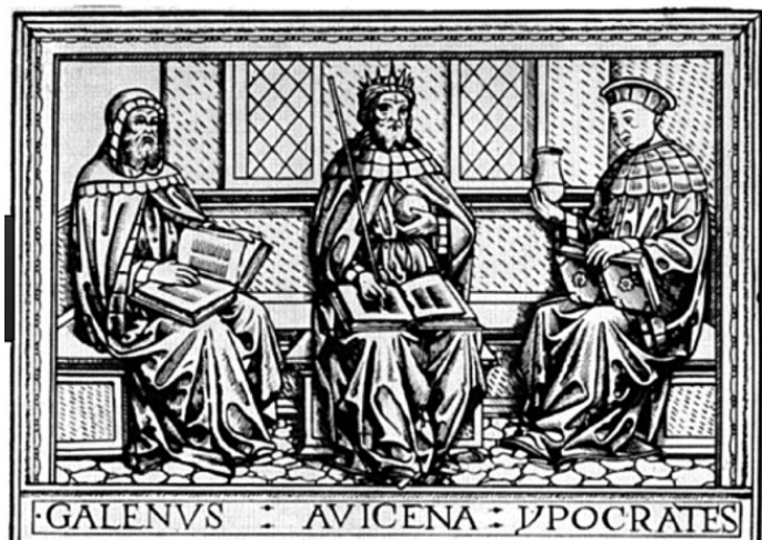
Рис. 2. Гален, Авиценна и Гиппократ

ти книг, составлявших библиотеку медицинского факультета Сорбонны в 1395 году)