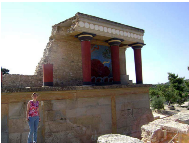
Греция, о. Крит, Кносский дворец

Дворцовые комплексы, в том числе самый знаменитый Кносс, Дедал, построивший лабиринт, Минотавр, Икар – все эти названия и имена знакомы нам со школьной скамьи. Но это только главная зацепка. Крит – это же Греция, так что аргументов «за» еще очень много.