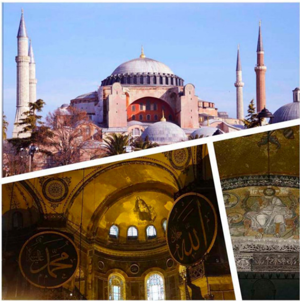
Турция, Стамбул, Айя-София