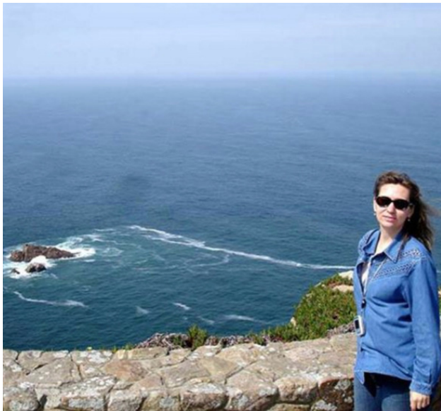
Португалия, Мыс Кабо да Рока