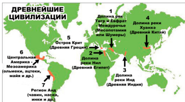
Карта древнейших цивилизаций

I тыс. до н.э. – Регион Анд (чавин, наска и др.)