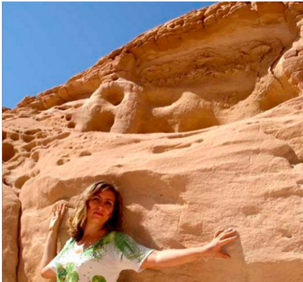
Египет, Синайский полуостров, Цветной каньон