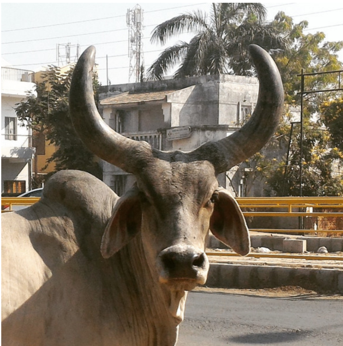
Индийская корова на проезжей части

Коров почтительно обходят или объезжают, повышая на них голос только, когда отгоняют от овощных прилавков на рынке.