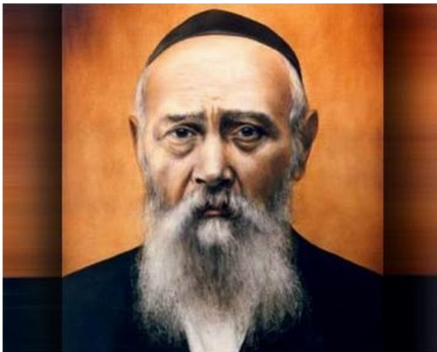
Рабби Леви Ицхак Шнеерсон. Источ-

«Рабби Леви-Ицхак Шнеерсон – прямой потомок знаменитого Цемах-Цедека – родился 18 Нисана 5638 (1878) года. С юности он отличался выдающимися способностями к учебе. Позднее он получил „смиху“ (свидетельство о посвящении в раввины) от таких знаменитых талмудистов как рабби Хаим Брискер и рабби Хаим Майзлиш из Лодзи. В рекомендательном письме р. Хаим сравнил Леви-Ицхака с золотым самородком». [2]