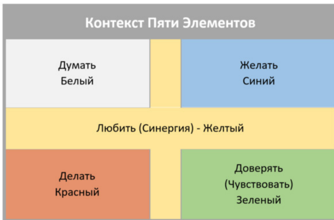
Прямоугольная модель для контекста Пяти Элементов

Например, кроме модели Латинского креста, мы будем активно использовать прямоугольную модель (см. прямоугольную диаграмму Контекста Пяти Элементов 2 ).