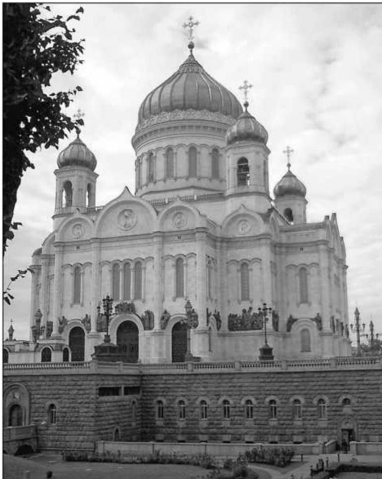
Храм Христа Спасителя