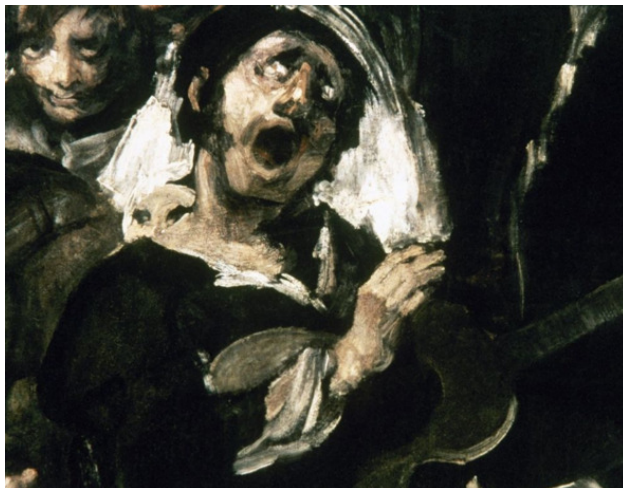
К нам, к нам... Время пришло... Ф. Гойя (фрагмент картины)

И тут эти шевелящиеся светлые овалы стали приобретать черты человеческих лиц, страшных и искаженных. Подобные он видел на картинах Франциско Гойя.