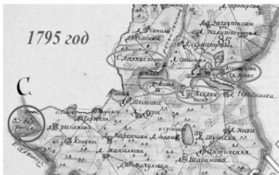
«План Генерального межевания Невельского уезда» 1795 год