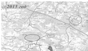
Фрагмент карты «Невельского района» 2015 год