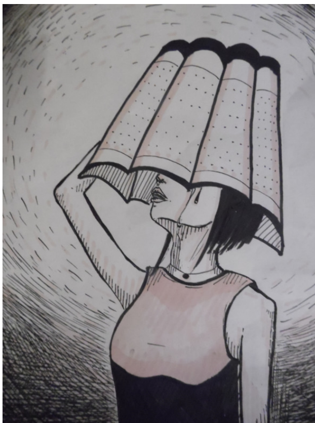
Рис. Крымовой Валерии