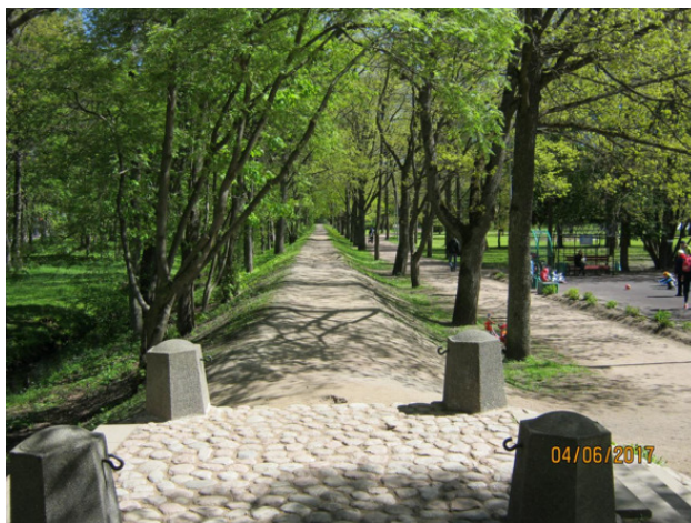
Земляные укрепления, возведённые ещё во время войны со Швецией в 1788 году