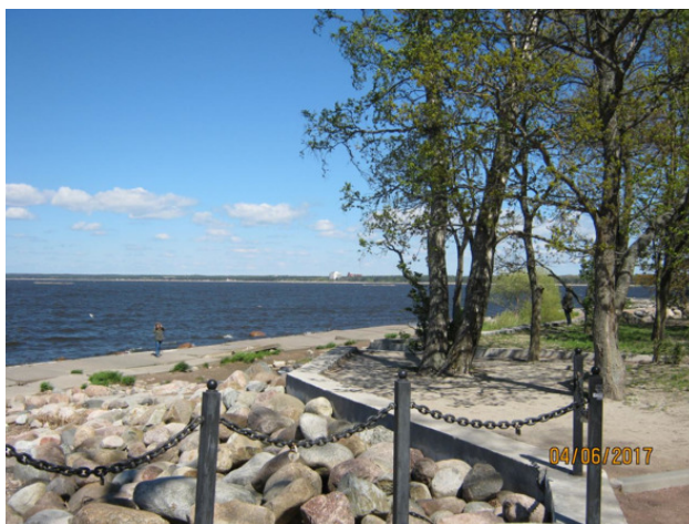
Здесь, на Дубковском мысу, в июне 1854 года англо-французская эскадра

Оборона Санкт-Петербурга длилась целый год. 14 июня 1854 года англо-французская эскадра подошла к Сестрорецку с целью его захвата и предприняла обстрел укреплений на Дубковском мысу. Однако, благодаря ответным мерам с русской стороны, союзники так и не смогли высадить десант.