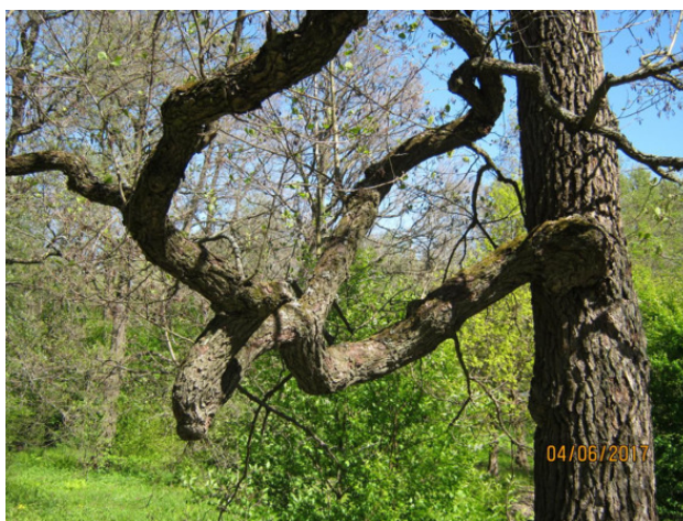
Скрученный ветрами Балтики, но несломленный дуб-ветеран!