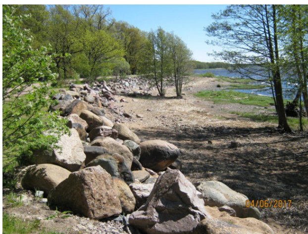
Естественные береговые укрепления

Оборона Санкт-Петербурга длилась целый год. 14 июня 1854 года англо-французская эскадра подошла к Сестрорецку с целью его захвата и предприняла обстрел укреплений на Дубковском мысу. Однако, благодаря ответным мерам с русской стороны, союзники так и не смогли высадить десант.