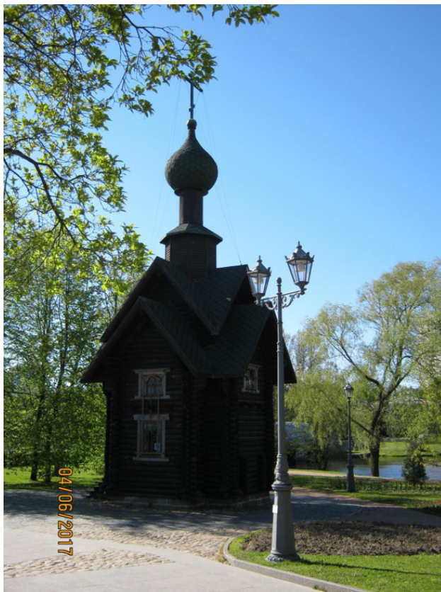
Вид часовни с юго-востока