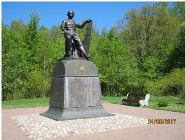
Памятник Петру I в парке «Дальние Дубки»

Забегая вперёд, отмечу не без гордости, что Сестрорецк расположен на самой северной в мире – в мире! – границе произрастания дубовых рощ. Отдельные дубы можно встретить и много севернее (в Канаде, на Аляске, в Швеции, в Норвегии...), но вот, дубовые рощи... – А поэтому, думаю, здесь самое место насладиться завораживающими пейзажами «Дальних Дубков», раскинувшихся на северном побережье Финского Залива.