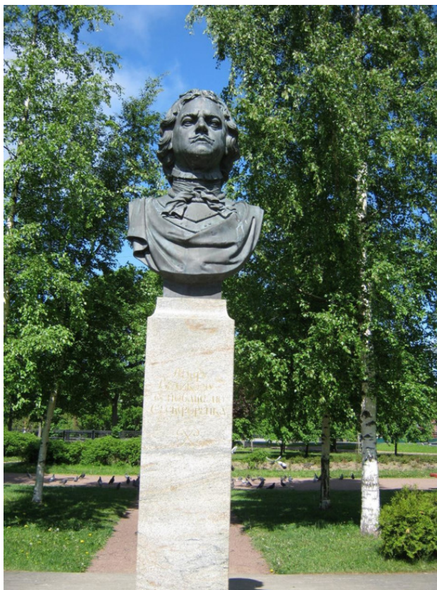
Памятник Петру Великому, основателю Сестрорецка

После внушительной победы русского флота над шведами при Гангуте (27 июля 1714 года) у царя возникла мысль увековечить это событие: Пётр повелел построить две загородных резиденции – одну (парадную, под названием Петергоф) решено было основать на южном берегу Залива, другую (рабочую) – на северном, в устье реки Сестры. 20 сентября 1714 года он лично обследовал устье Сестры и остался весьма доволен. Эта дата и является Днём Рождения Сестрорецка! Здесь решено было построить Летний дворец и парк.