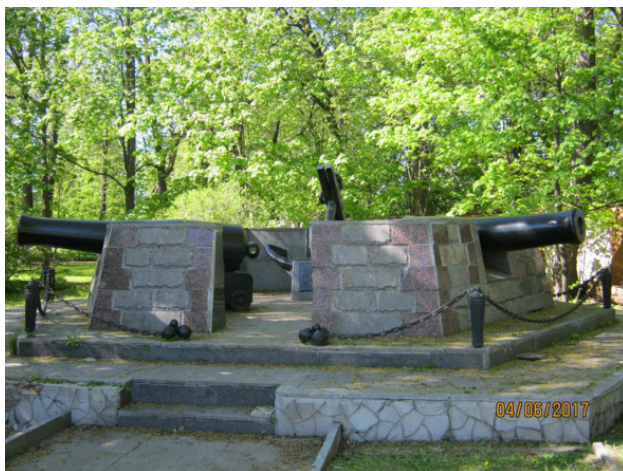
Памятный знак в честь 300-летия основания Сестрорецка