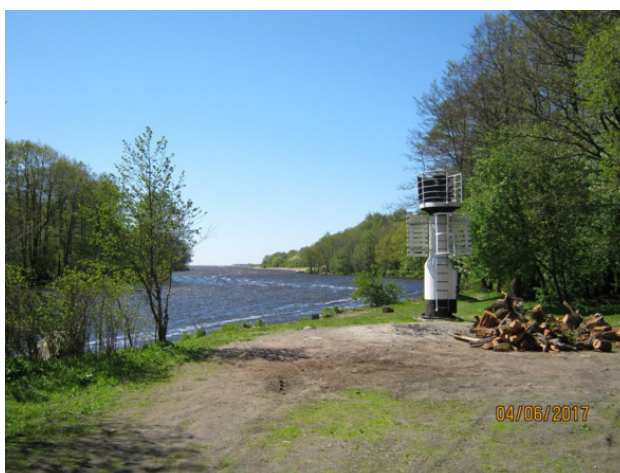
Сигнальный бакен у Залива