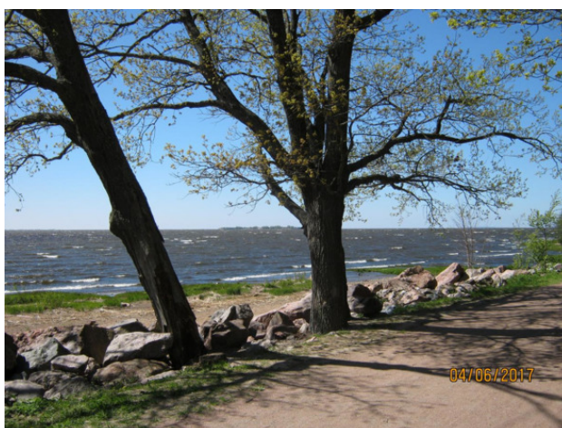
Дубковский мыс (вдали виден один из островных фортов)