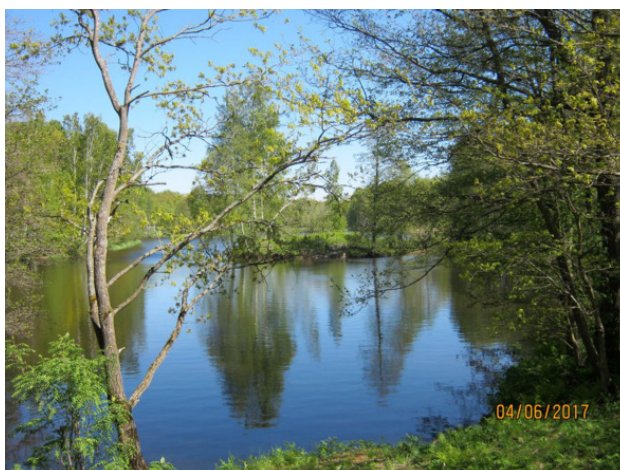
Озеро в центре парка