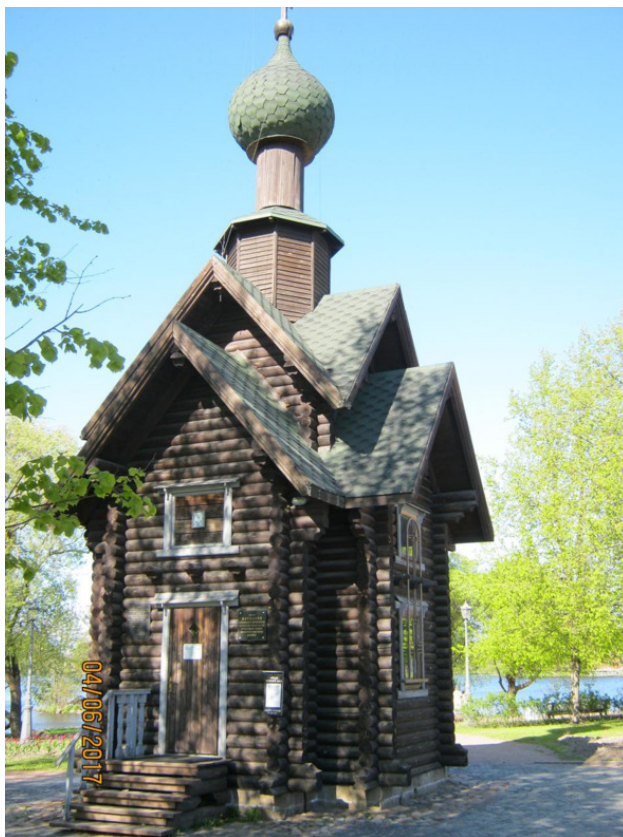
Часовня Свяителя Николая Чудотворца (вид с юго-запада)