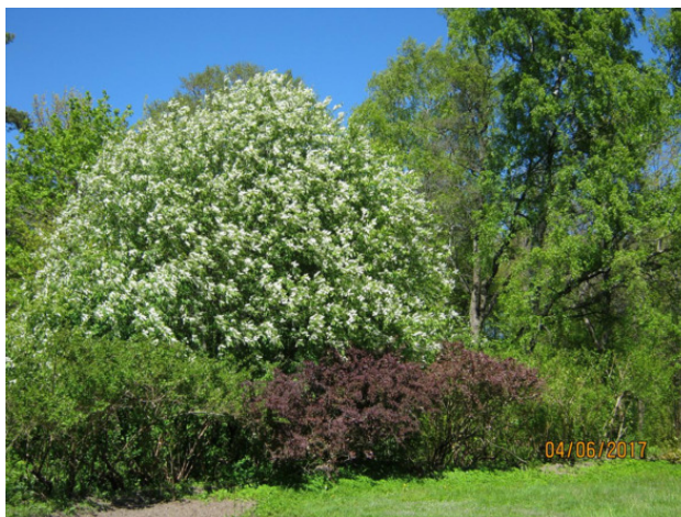
Чарующие виды парка