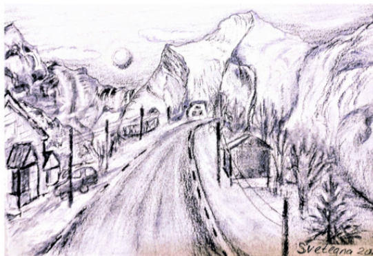
Чёрное и белое, 2018

Воспоминание из школьного периода. В школьной программе был рассказ о маленькой девочке, желающей иметь красивые красные туфельки и у мамы этой девочки не было для этого достаточно денег. Рассказ про капиталистический жестокий мир. Я помню как учительница говорила нам, какие мы счастливые, что живём в Советском Союзе, где государство заботится о всех детях. Так же всплыл случай из моей жизни. Моя мама отправила меня в магазин купить 100 граммов жира, на большее не было денег. Мне было очень стыдно и неудобно от этого. Я боялась просить продавца взвесить мне 100 граммов жира. Жир в упаковке по 250 граммов лежал открыто и не нужно было просить, но у меня не было для этого денег!!!! Вот так переплетались пропаганда счастливого общества и реальности жизни. Многие психологи скажут прямо, что это дало мне неуверенность в себе и страх, который сдерживал мою жизнь долго.