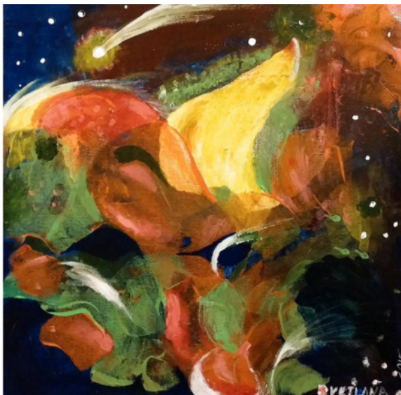
Первая работа, 2015

Долгое время я жила нормальной жизнью большинства людей. Трудности, встававшие на моём пути учили меня. Я переносила их по-разному. Были моменты глубокого отчаяния и даже нежелания жить. Неудовлетворенность жизнью подтолкнула меня на поиск смысла жизни. Мне начали попадаться книги, к тому времени в стране началась «перестройка». Из книг мне открылся смысл религии и духовного развития. Чтобы подняться к свету я прошла через дно падения в самую бездну. Опыт, приобретённый моей душой, бесценен. Я начала рисовать в зрелом возрасте. Это бы-