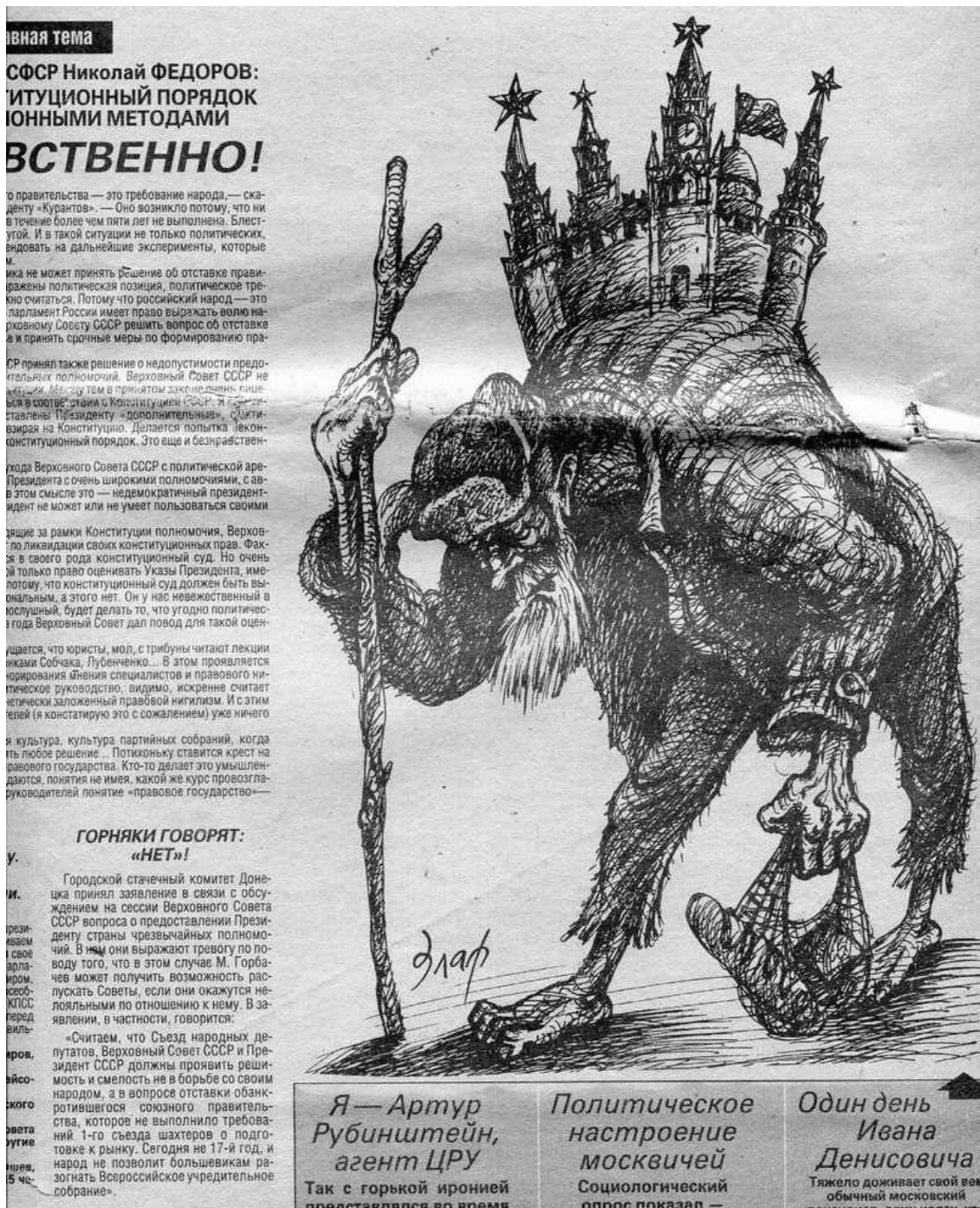
На горбу советских «рабов» держалась кремлёвская власть. («Куранты», 27 сентября 1990 г. Автор рисунка — Михаил Златковский.).