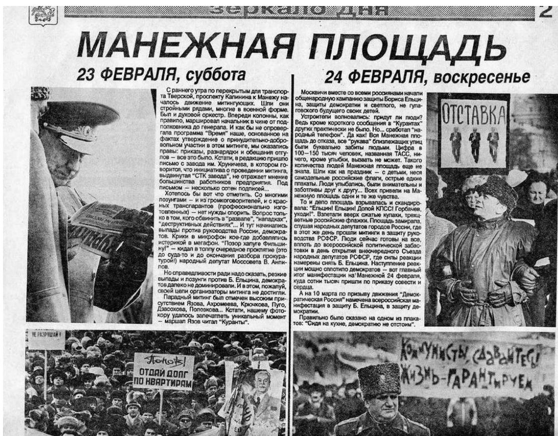
Митинговали в 90-е много. Всякие, с разными лозунгами. В левой части газетной страницы – репортаж о митинге защитников горбачёвского, то есть коммунистического режима, в правой – сторонников реальных демократических преобразований... Для меня так и осталась загадкой, почему последний советский маршал, министр обороны СССР Дмитрий Язов