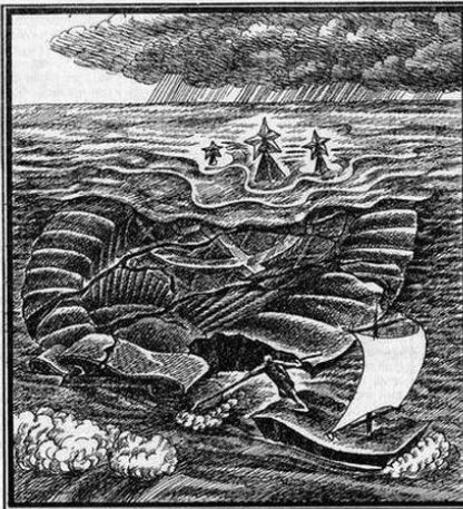
Рис. В. ХАХАНОВА.