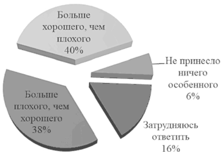
Рис. 4. Оценка эпохи Сталина согласно результатам всероссийского опроса общественного мнения, проведенного «Левада-Центром» в феврале 2016 года 40

Что ж, к какому бы мнению исследователи и общественность в итоге не пришли относительно пропорции положительного и трагического в деятельности Сталина, очевидно, что прорыв, который осуществила страна под его руководством, вывел ее в число передовых государств, приблизил по экономическим показателям к уровню стран Запада, говоря словами самого Сталина, оставил далеко позади «нашу вековую „рассейскую“ отсталость» 41 . Об этом стремительном экономическом взлете, именуемом сталинским «экономическим чудом», пойдет речь далее.