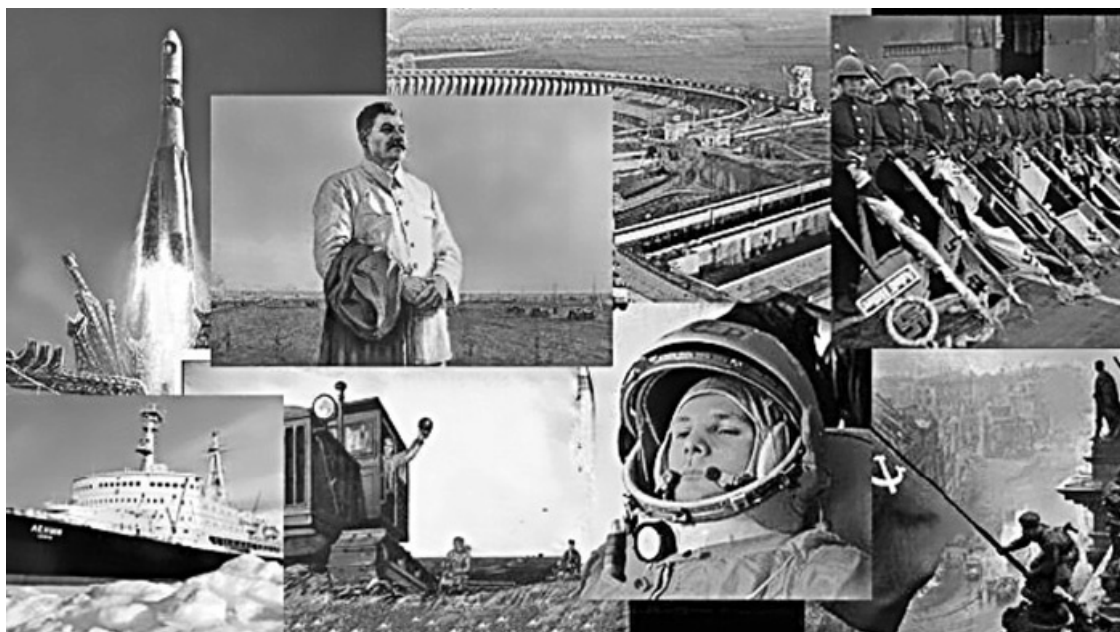
Рис. 2. Достижения сталинской экономики

Чем дальше в прошлое уходит сталинская эпоха, тем яснее осознаются величественные замыслы и масштабы достижений того времени, тем отчетливее представляется, какой мощный прорыв совершила в своем развитии великая страна. Хотя до сих пор приходится слышать, что советский проект развития представлял собой некую утопическую конструкцию, неудачный эксперимент, что созданная экономическая система была неэффективной, расточительной, самоедской, неконкурентоспособной, держалась на принуждении, рабском труде, страхе. Какие только эпитеты не подбирают для ее описания – тоталитарная, казарменная, репрессивно-командная, деспотичная, лагерная экономика... Те, кто дает такие уничижительные определения, навряд ли уяснили, что большинство наших достижений и побед, которыми мы гордимся сегодня и будем гордиться всегда, родом именно из сталинского времени (рис. 2). А подневольным, непроизводительным рабским трудом крепкую экономику, сильную державу с развитым индустриальным, научным, военным потенциалом не построишь.