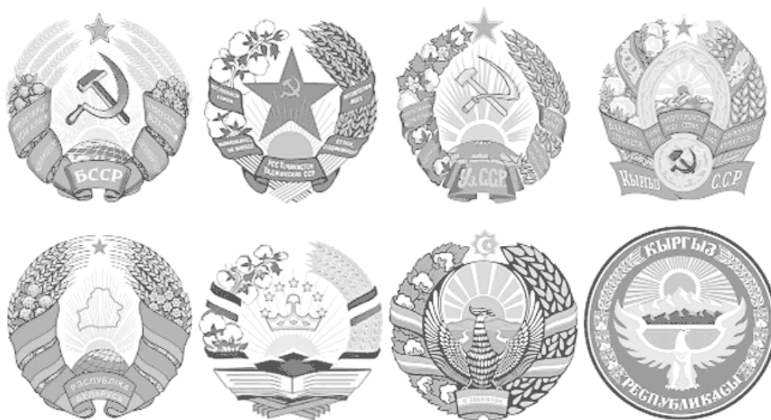
Рис. 3. Созданные в сталинскую эпоху гербы Беларуси, Таджикистана, Узбекистана, Киргизии (сверху) и гербы этих республик в наше время (снизу)

Современная Россия, Беларусь, республики Средней Азии переняли ряд государственных атрибутов того времени. Музыка и текст сталинского гимна (гимна партии большевиков, впоследствии преобразованного в гимн Советского Союза) лежат в основе нынешнего государственного гимна России. Сталинские красные звезды на башнях Московского Кремля продолжают оставаться символом страны. Под сталинским флагом, гербом и гимном – атрибутами Белорусской ССР с незначительными изменениями – успешно развивается современная Беларусь. За основу нынешних гербов и гимнов Таджикистана и Узбекистана, герба Киргизии тоже взяты сталинские символы этих республик (рис. 3) 27 .