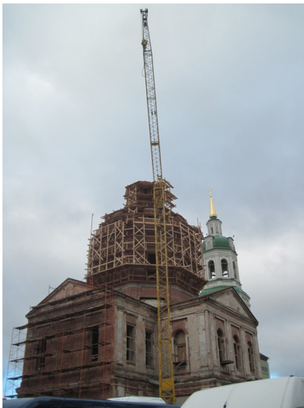
Спасский собор в Кирове.