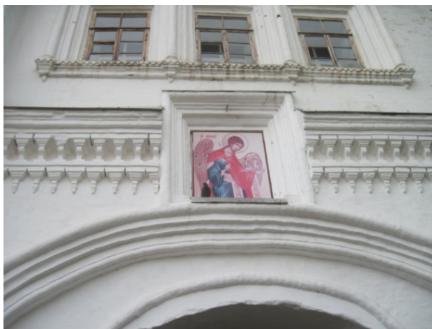
Голубь над входом в Трифонов монастырь.

Дальше старались идти с ними, но перед первой стоянкой, в Макарье, мы все равно их потеряли.