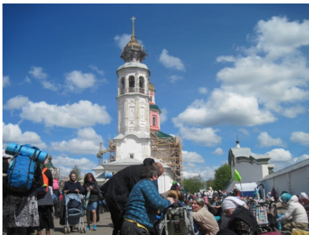
Первая стоянка. Макарье.