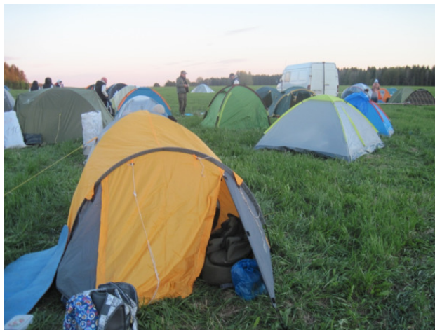
Великорецкий крестный ход. Июнь 2017 года. Палаточный лагерь в селе Бобино. Первая ночевка.

Палатка, кстати, вещь нужная, если она у вас есть и вы умеете ее ставить. Если же ее нет и надо у кого-то просить – не беда. Можно идти и без нее. Я не знаю, как было раньше, в другие года, но в 2017 году на каждом привале стояли многоместные палатки, которые уже не надо ставить – заходи внутрь, бери свой коврик, расстлай его, залезай в спальный мешок и спи. Все готово, все предусмотрено. Только иди. А Господь о тебе позаботится: о том, чтобы у тебя были горячая пища и ночлег. В этом я убедилась на собственном опыте: так и есть.