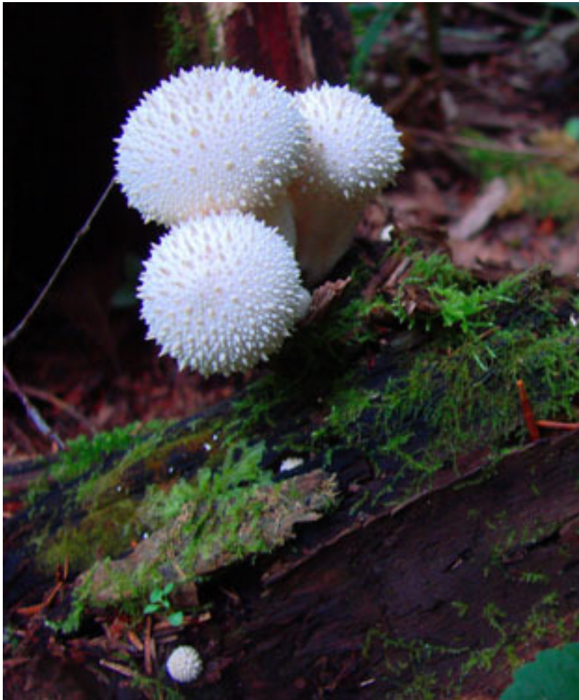
Дождевики обыкновенные, жемчужные, или шипастые