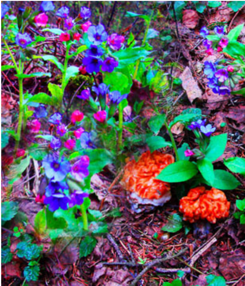
Гигантский строчок рядом с примулой-первоцветом