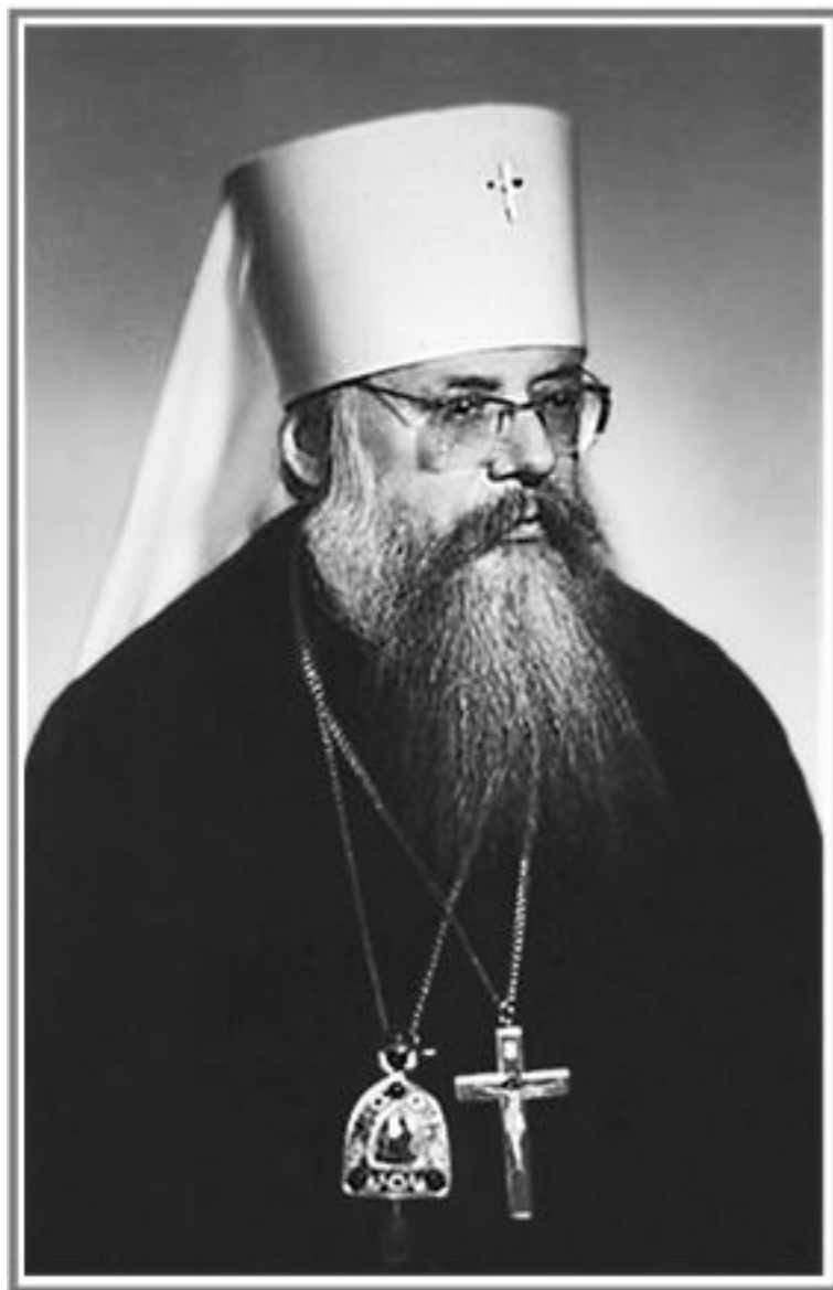
Митрополит Леонид (Поляков)

лось, что постригал их один человек: одну – архимандрит Иоасаф, а другую он же – архиепископ Иоасаф! Было так радостно! Как все связано в духовном мире! Дивны дела Твои, Господи!