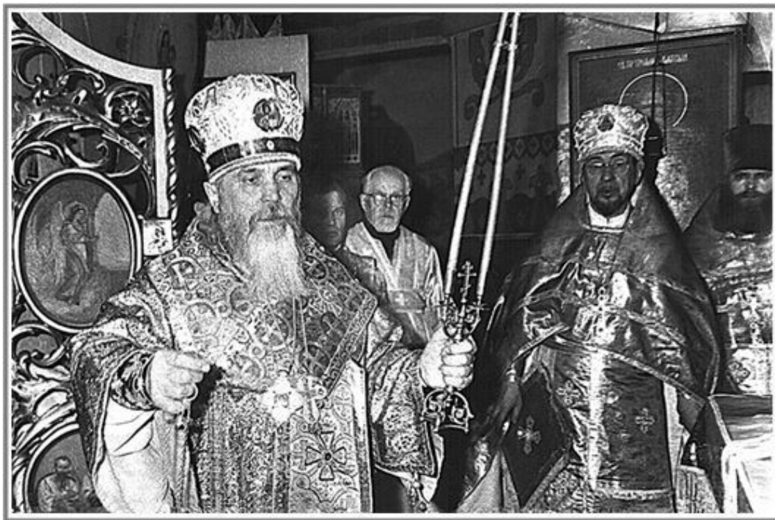
Архиепископ Иоасаф (Овсянников) во время служения Литургии

будучи восьмилетним мальчиком. И тогда одно только это впечатление от увиденного монаха так потрясло юную душу, что с этого момента владыка влюбился в монашество и это была его первая и единственная любовь во всю жизнь. Ребенком он уже наряжался в «мантию» и из тыкв делал себе митры. С батюшкой их связывали совместные дела, глубокое взаимное почтительное отношение, единомысленный взгляд на многие вещи.