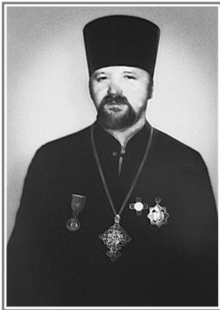
Протоиерей Василий Дьолог

отбирали паспорта, сопротивлявшихся избивали. Монахов арестовывали и сажали в тюрьму, причем в камеру бросили и самого настоятеля, архимандрита Севастиана.