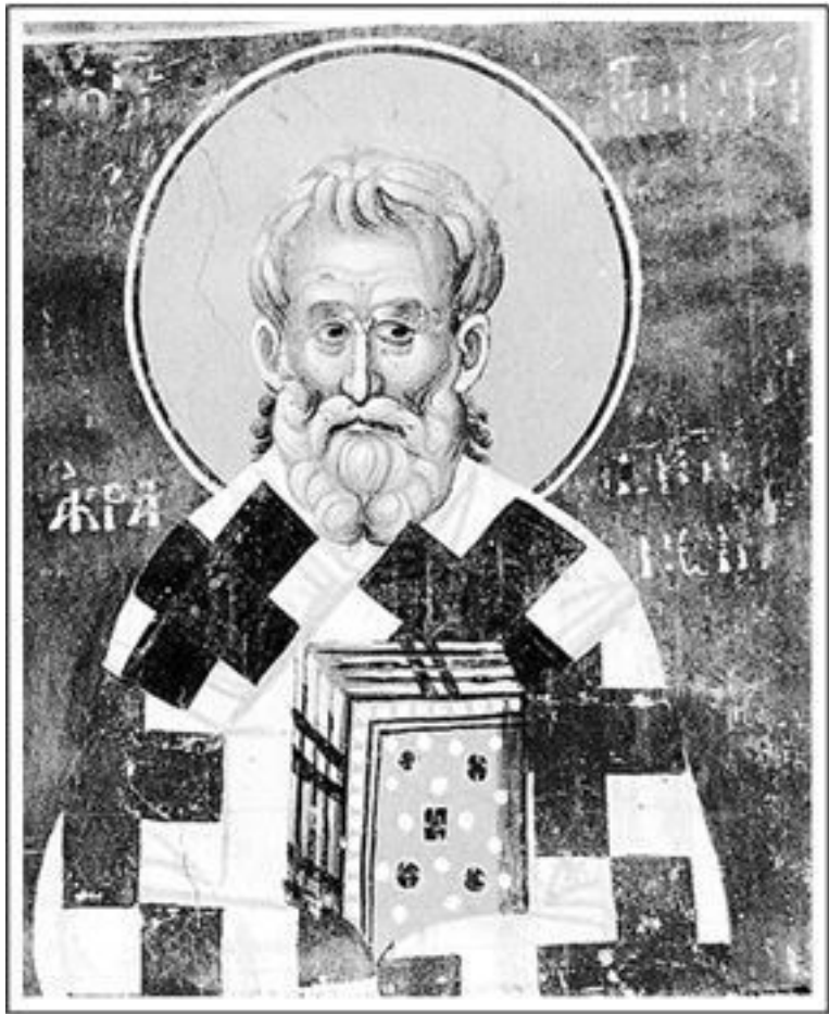
Св. Григорий Антиохийский

В то время в Палестине славился отшельник Сергей, под-