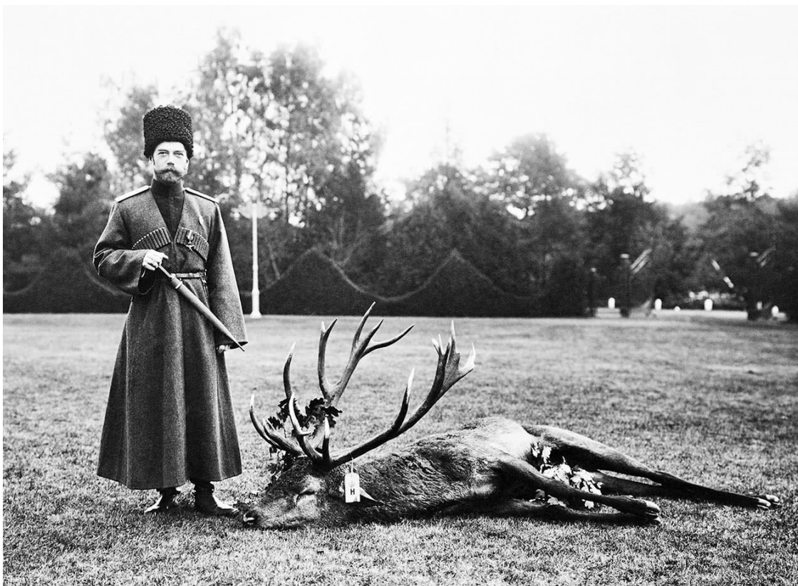
Николай II на охоте в Спале. Фотография из семейного альбома Романовых. 1912-1913 годы

Двор отдалялся от света постепенно, и одновременно двор отдалялся от семьи. Александра Федоровна полагала, что все сравнивают ее со свекровью, Марией Федоровной, считают, что она плохо говорит по-русски. Это было не так, мы видим письма государя и государыни – они написаны прекрасным русским языком. Но последняя императрица была мнительна, трудно сходилась с людьми.