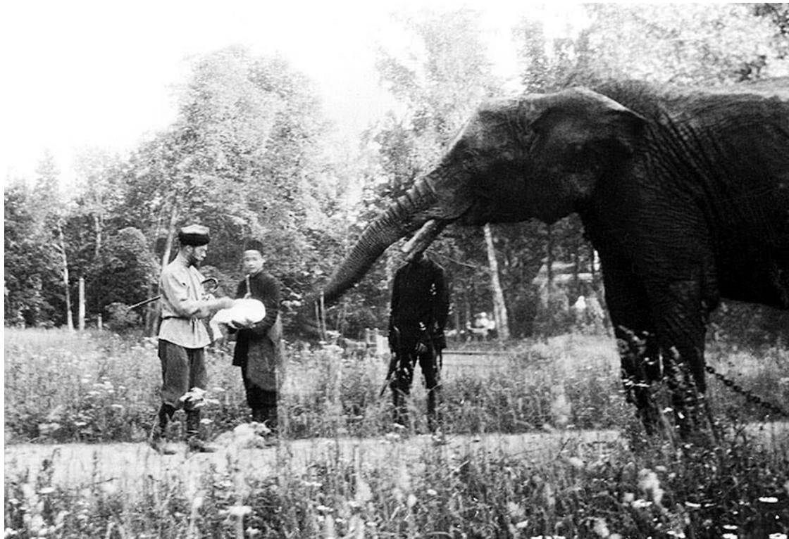
Николай II и слон в Царском Селе

Царском Селе павильоне в индийском стиле («Павильон для слона»). Слоны были добродушны и вызывали умиление у посетителей, ругался только егерь – он жаловался, что животное ежедневно съедает 2 пуда лепешек на чистом сливочном масле. Судьба последнего слона трагична: он был застрелен в 1917 году революционными матросами.