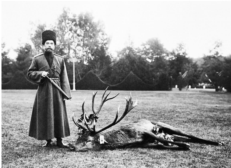
Николай II на охоте в Спале. Фотография из семейного альбома Романовых. 1912-1913 годы

В последующих записях до 1918 года упоминаний об охоте нет.