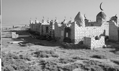
мазар — могила мусульманского «святого»