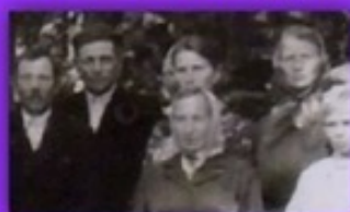
Эстонские поселенцы, их жизнь и судьба. Очерк Алексея Ефимова