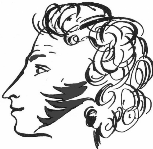
Автопортрет Пушкина 1