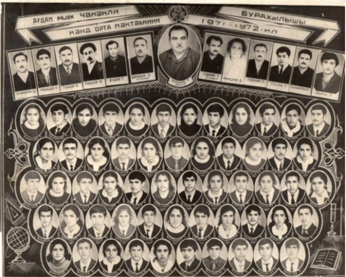
Şəkildə Ağdam rayonu, Çəmənli kənd orta məktəbinin 1971/72-ci il buraxılışı.