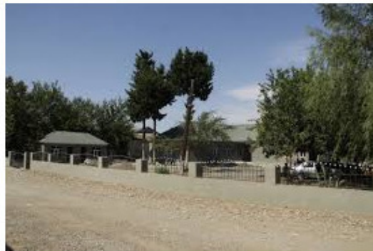
Bakı, Çəmənli, mart 2011-ci il.

Dəlixana sarıdan da Koroğlumuz yoxdu, «şükür»! İndi çoxu əsgərliyin orda çəkir. Sonra ona daşdan keçən Kağız verir dəlixana. «Devit be»dir, silah vermək olmaz ona. Atasının pul kisəsi, Cağbacağı Mercedesi dura-dura, Dəli hara, əsgər hara? Ağrımın tək başı, Kim istəyir töhmət etsin. O dəlidi-ağıllıdı, qoy dəlilər xidmət etsin. Ay papanın gül dəlisi, Ay mamanın gül dəlisi, Get özünə başqa ad qoy, Dəliliyə dəymə, bala! Dəli sənə tutar bir toy, Çox özünü öymə, bala! O dəlilik kağızını cırıb tulla. Kəmər qurşa, Qılinc bağla. Xəbər göndər haykazlara. Dəli, dəli görməyincə, Dəyəyəyin qısmaz dala. Hünər göstər, Ad-san qazan! Onda deyim, sən Dəlisən! Kağız-kuğuz Dəliliyə Əsas vermir «dəli» bala!..