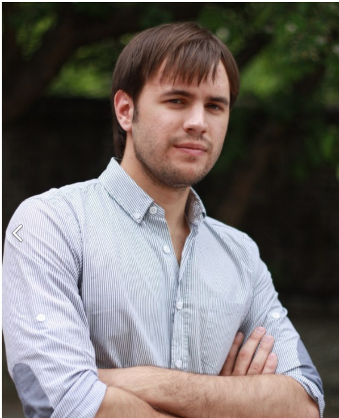
Так я выглядел в последний год работы в банке

Я вышел из кабинета и направился к машине, по пути ловя кучу косых взглядов в мою сторону. В тот момент я ни с кем не хотел разговаривать. Через две недели меня здесь не будет, и мое имя забудется, как и сотни других имен бывших сотрудников. На протяжении всего времени я думал о том, что покину банк, но, признаться, не думал, что так скоро. Тут не работает кредит доверия: если ты кому-то не нравишься, и они знают, как тебя убрать – они это делают. Здесь нужны только связи, которых у меня не было. Никто не заступится за меня и не замолвит словечко.