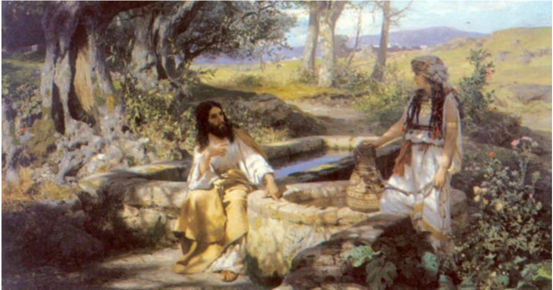
Семиградский Г. Христос и самаритянка, Львов, картинная галерея

В Самарии есть град Сихарь, Через него Спаситель шёл. Колодезь вырыли там встарь, Иаков воду ту нашёл.