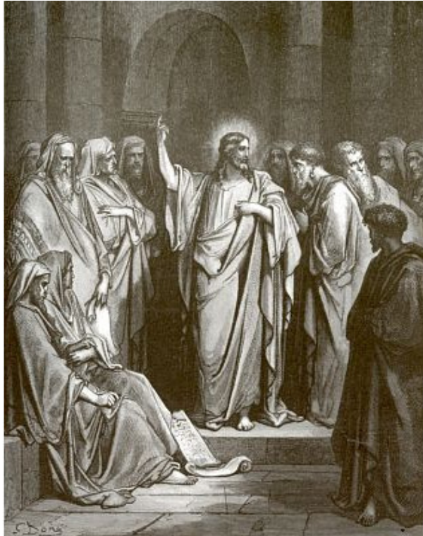
Доре Гюстав Иисус Христос в Назаретской синагоге, Франция

Пришё в субботу в синагогу, Что в Назарете находилась, Христос, там чтение от Бога Священной книги проводилось.