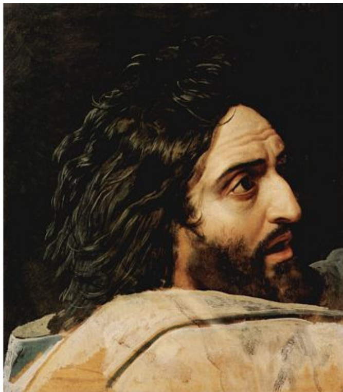
Иванов А. А. Голова Иоанна Крестителя, Москва, Третьяковская галерея.

Двоих учеников послал К Иисусу Иоанн Креститель, Чтоб каждый подлинно узнал, Кто сей в народе Утешитель?