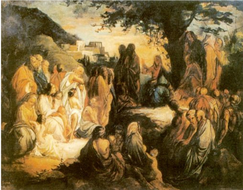
Ломтев Николай Нагорная проповедь, Санкт-Петербург, Русский музей.

О приближеньи Царства вести Из уст в уста по всем предместьям И близлежащим городам Текли и ширились и там Потком светлым подхватили Искавших истины, в ком были Неудержимы их стремленья Достичь духовного прозренья.