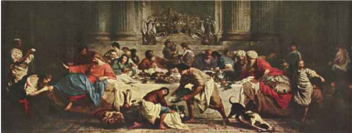
Сублейра Пьер Пир в доме Симона, Париж, Лувр.

Жил фарисей с прозванием Симон, В свой дом Иисуса пригласил он, С ним вместе трапезу вкусить, Пророка как не пригласить?