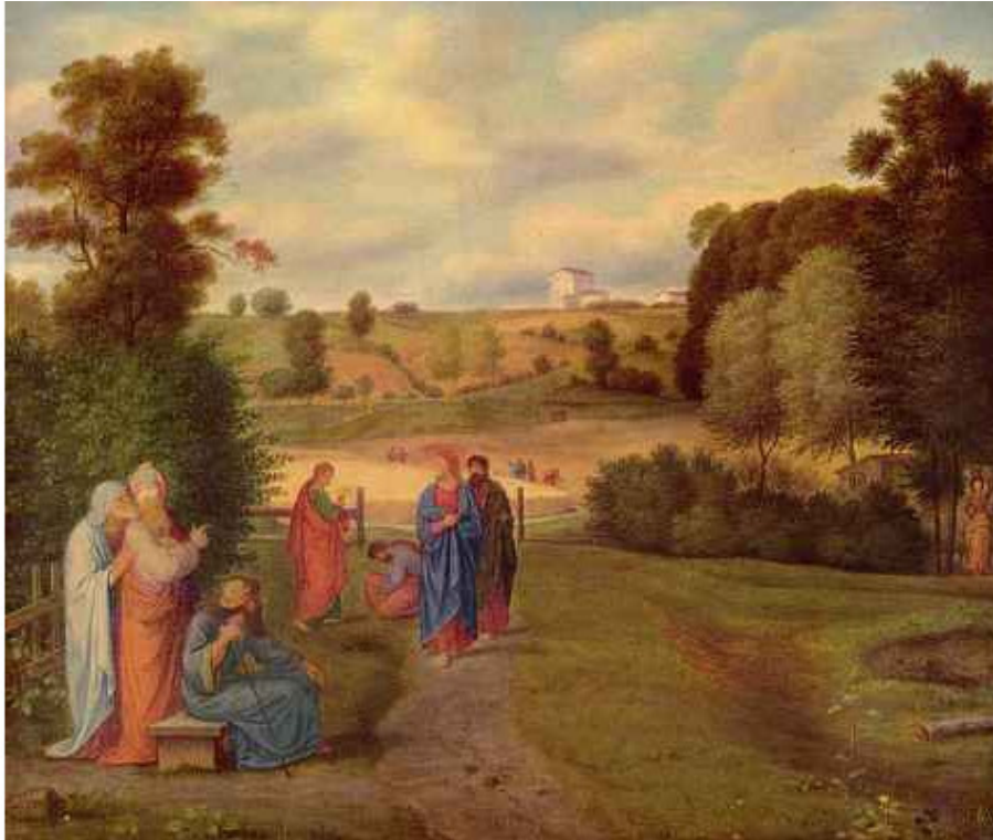
Веронезе Паоло Христос и сотник, Мадрид, Прадо.

С горы во град Спаситель шёл, Закончив проповедь к народу. Вновь Капернаум в Нём обрёл От Бога Свет, живую воду.