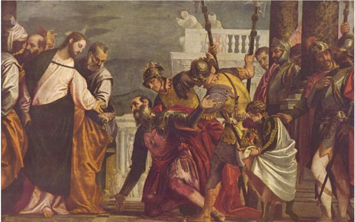
Веронезе Паоло Христос и сотник, Мадрид, Прадо

Надежда, вера, ликование Вновь Галилею охватили. Чудес Иисусовых желанья Народом вновь руководили.