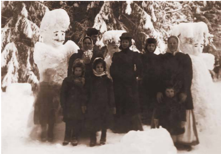
Прогулка в Павловском парке. Начало XX века