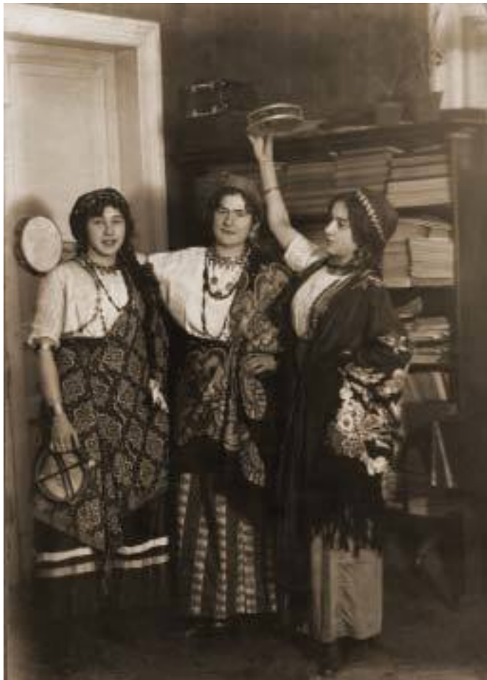
Веселый маскарад у Савиновых