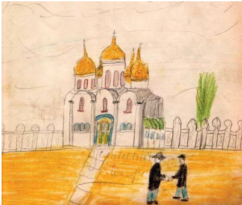
Успенский собор. Рисунок Кати Савиновой. 1909 год