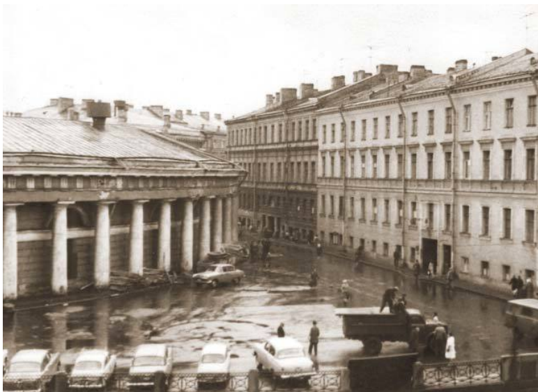
Вид из наших окон. 1960-е годы