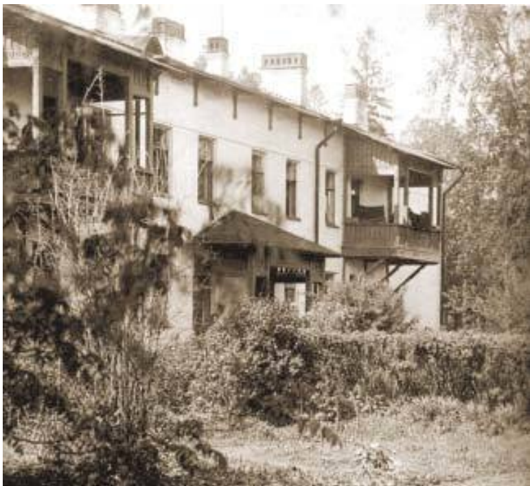
Дом для сотрудников обсерватории, Павловск. Начало XX века